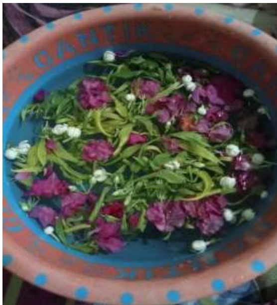
Gambar 2 Bunga Melati, Kenanga dan Bunga Kertas Untuk Upacara Mandi Baya