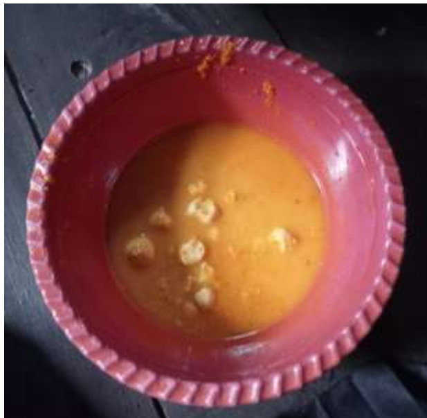
Gambar 4 Kunyit, Asam Jawa, dan Bedak Bulat Diracik Menjadi Satu Untuk Upacara Mandi Baya