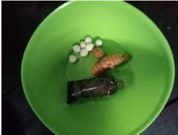
Gambar 3 Kunyit, Asam Jawa, dan Bedak Berbentuk Bulat Untuk Upacara Mandi Baya