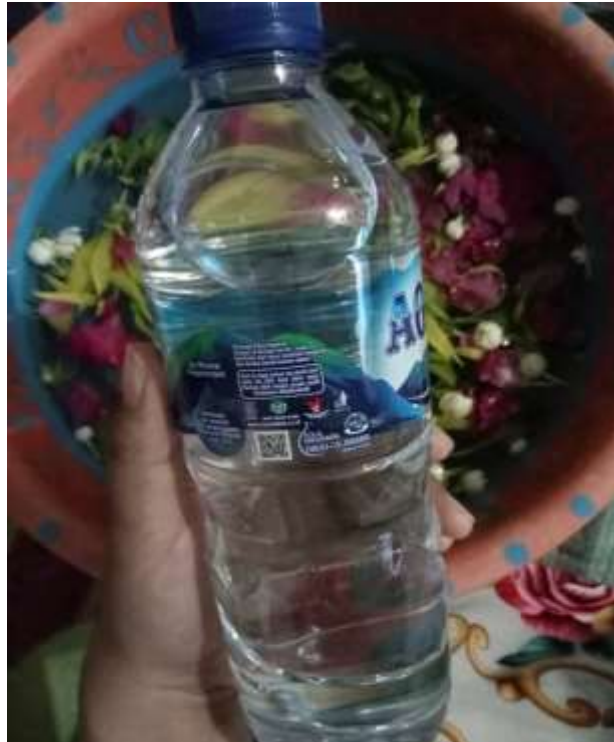
Gambar 5 Air Baya Yang Sudah Di Bacakan Do'a Untuk Upacara Mandi Baya