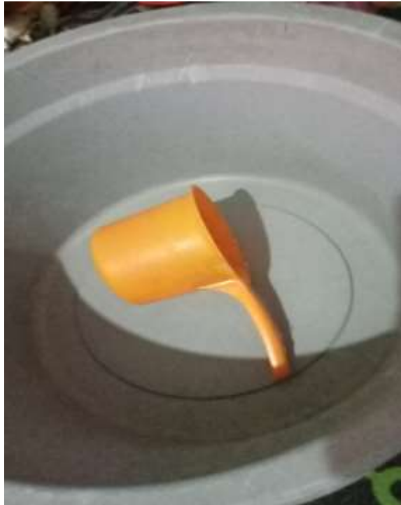
Gambar 1 Wadah Untuk Menampung Air dan Gayung

Alat dan Bahan Pada Saat Upacara Mandi Baya