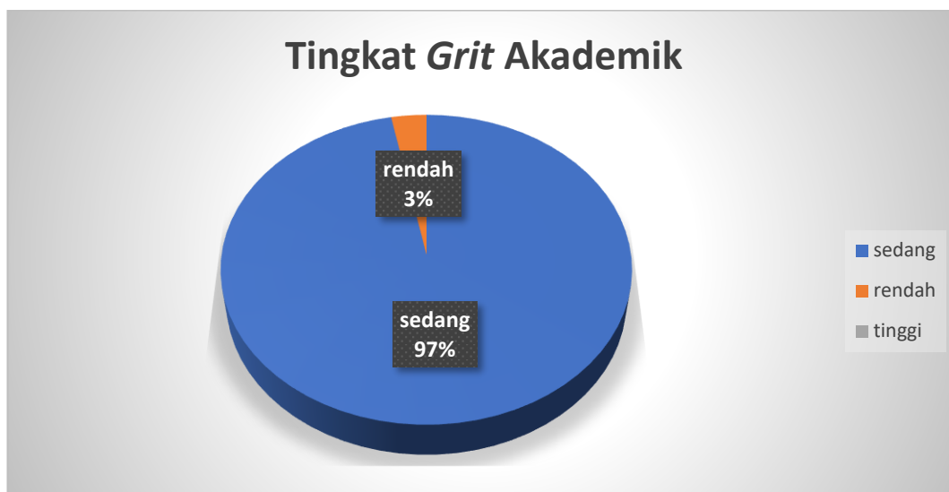
Gambar 4.2 Kategorisasi Grit Akademik