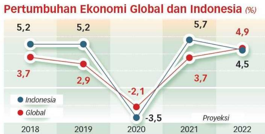
Gambar I : Pertumbuhan Ekonomi Global dan Indonesia

Dalam ekonomi, pandemi ini menyebabkan menurun drastisnya aktivitas perekonomian domestik yang menyebabkan banyak permasalahan sehingga tidak menutup kemungkinan akan menurunkan kesejahteraan masyarakat. Dalam jangka menengah, pertumbuhan ekonomi diproyeksikan akan terus menurun.