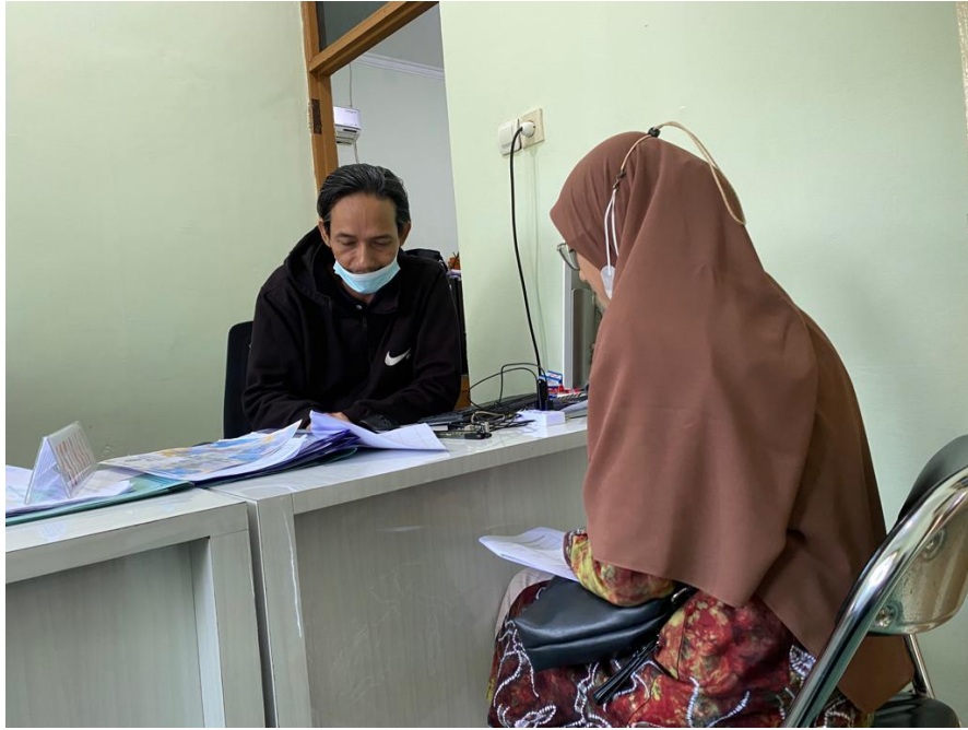
Wawancara dengan Tim PPDB dan Sataf TU