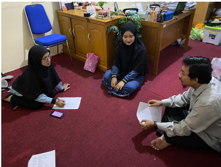
Wawancara dengan tim PPDB SMPIT Insan Madani