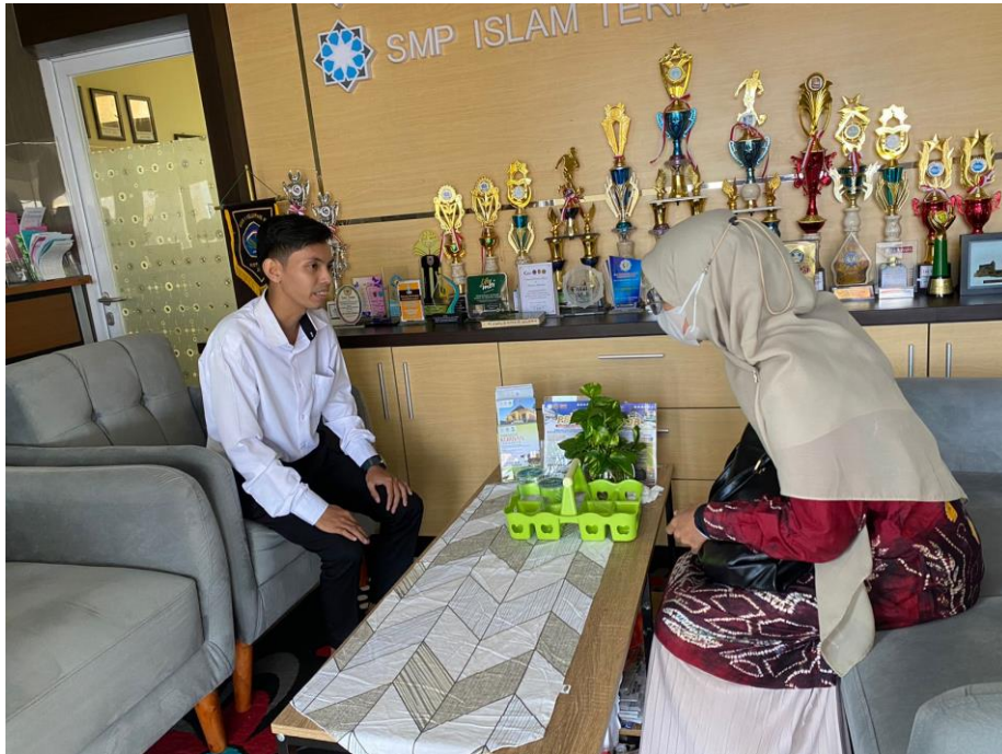
Wawancara dengan Staf TU SMPIT Ukhuwah