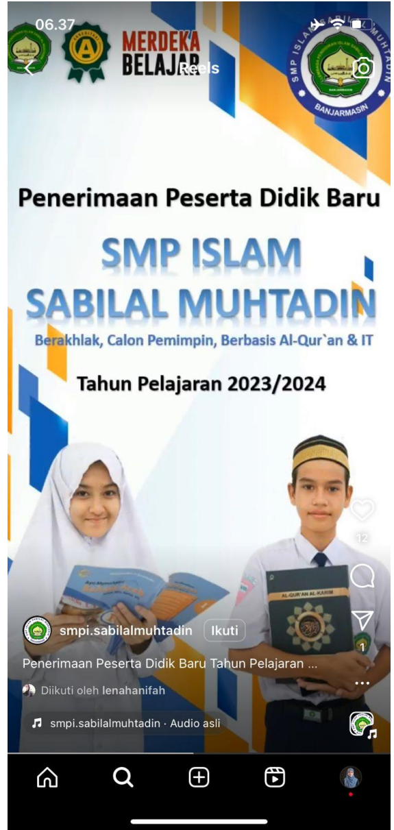
Promosi SMP Islam Sabilal Muhtadin pada media sosial