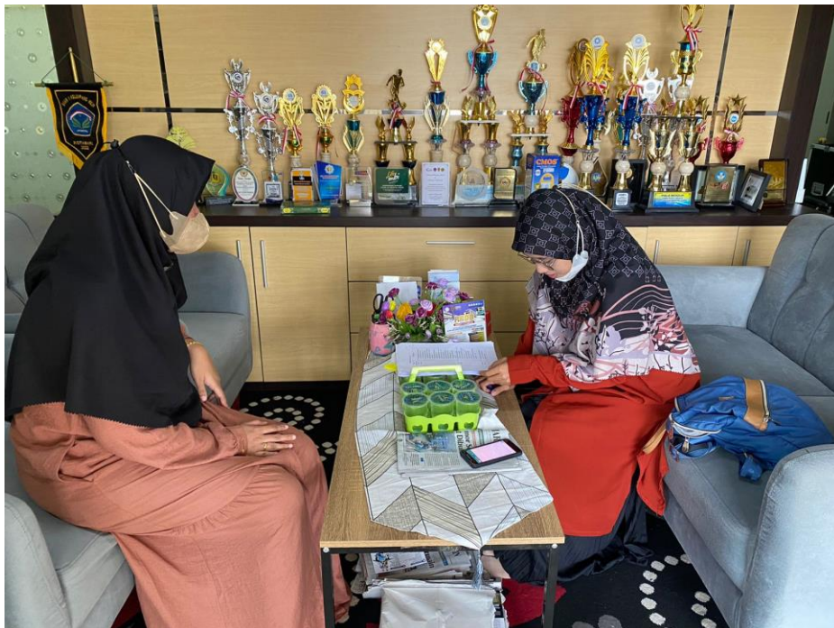
Wawancara dengan Tim PPDB Ukhuwah