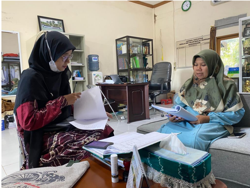
Wawancara dengan Kepala Sekolah SMPI Sabilal Muhtadin