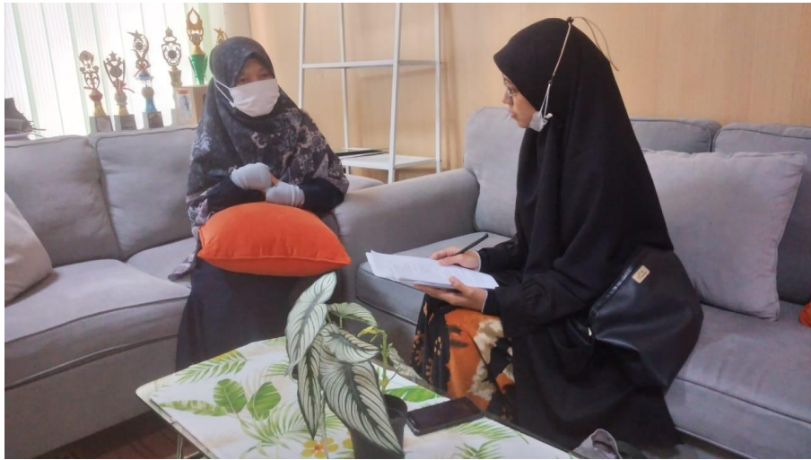
Wawancara dengan Kepala Sekolah SMPIT Ukhuwah