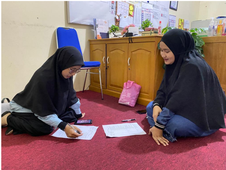
Wawancara dengan Staf TU SMPIT Insan Madani