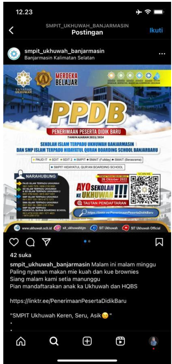
Promosi PPDB SMPIT Ukuwah pada media sosial