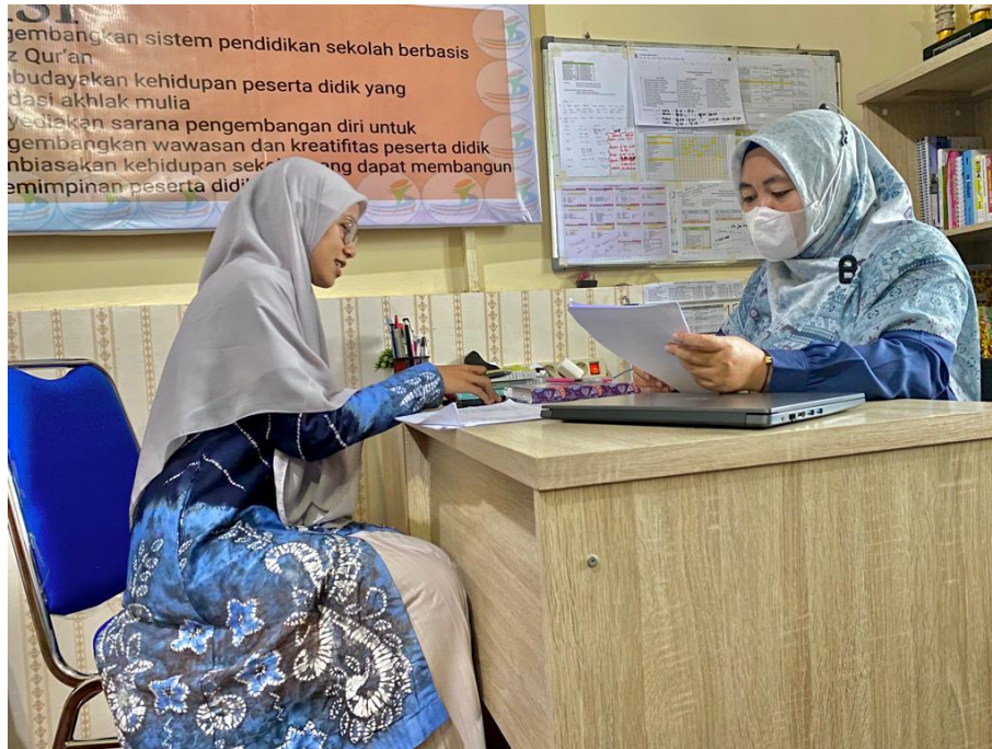
Wawancara dengan Kepala Sekolah SMPIT Insan Madani