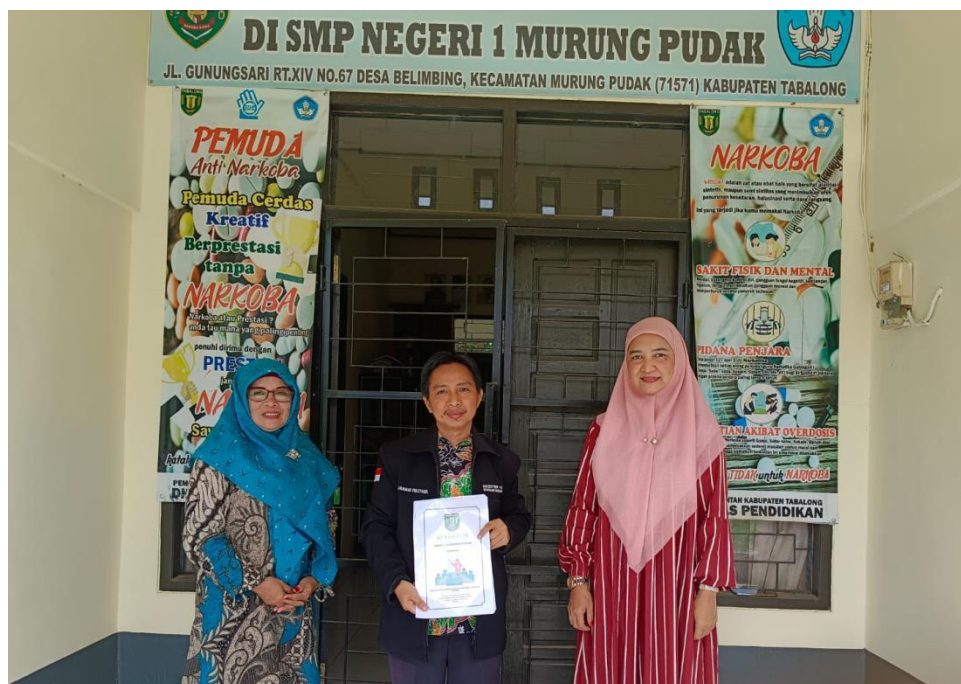
Dokumentasi bersama para guru setelah melakukan observasi dan wawancara di SMPN 1 Murung Pudak