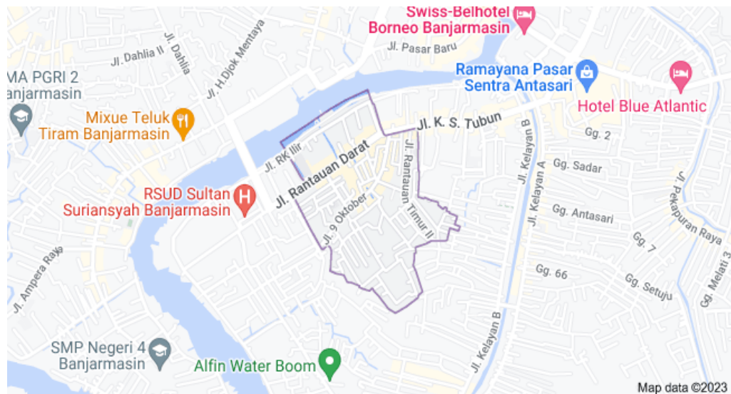
Peta Kelurahan Pekauman