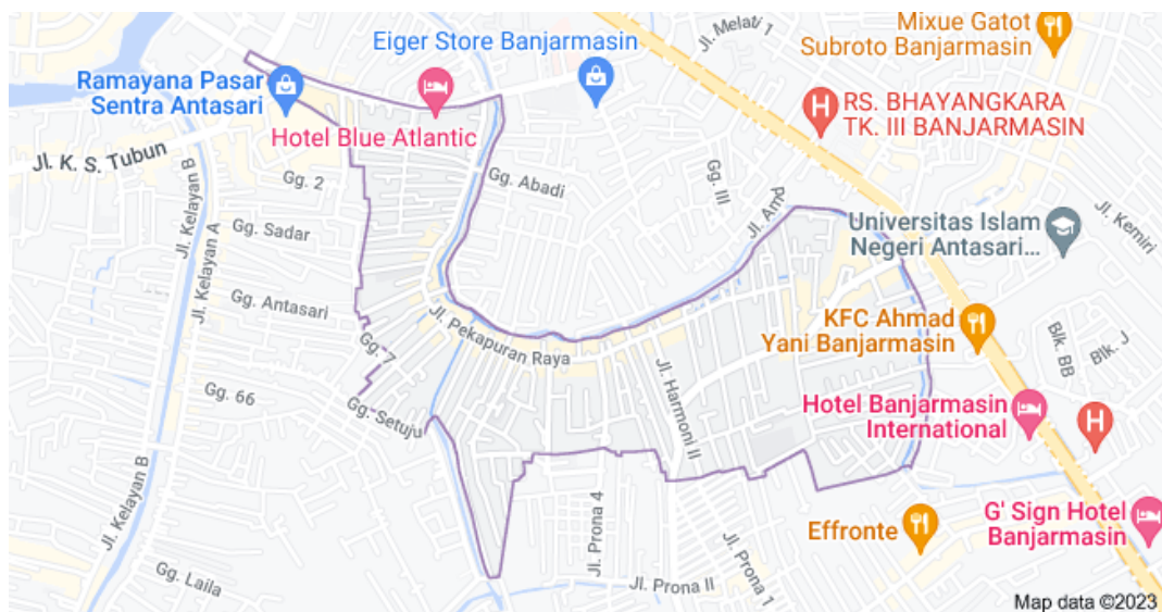
Peta Kelurahan Pekapuran Raya