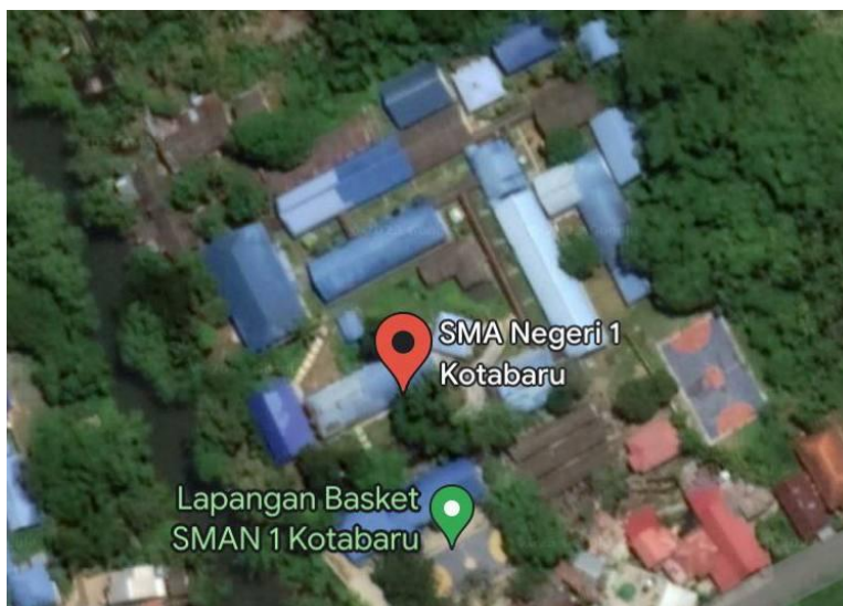
Gambar 3.2 Letak Geografis SMAN 1 Kotabaru

Penelitian ini dilaksanakan di SMAN 1 Kotabaru yang berlokasi di Jalan Berangas Raya KM 4.0 Nomor 39A, Sigam, Kecamatan Pulau Laut Utara, Kabupaten Kotabaru, Kalimantan Selatan. Letak SMAN 1 Kotabaru secara geografis dapat dilihat pada Gambar 3.2 berikut.