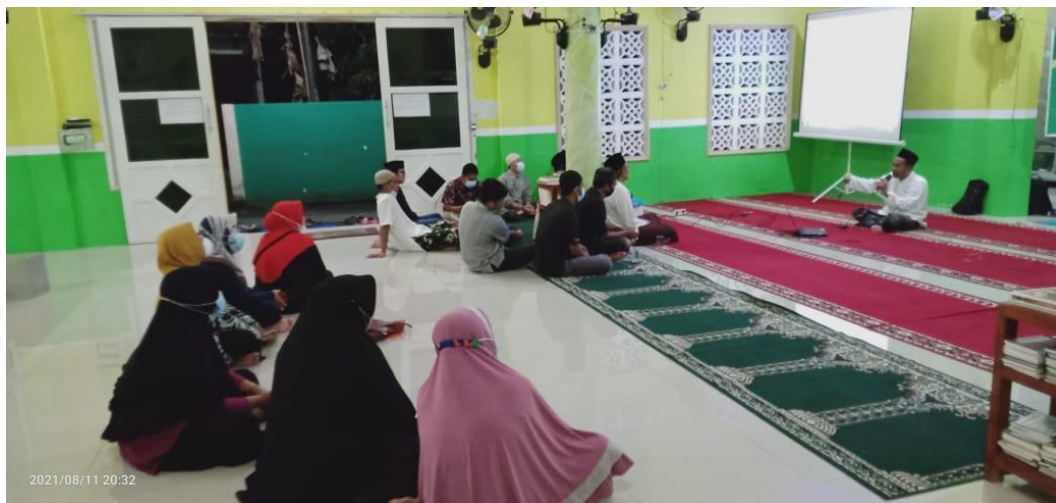
Gambar V Ilustrasi Posisi Jenazah Perempuan dan Posisi Imam serta makmum Dalam Peragaan Penyelenggaraan Jenazah