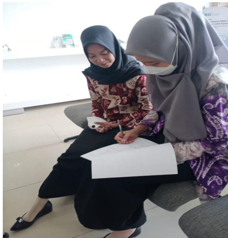
Pengisian kuesioner oleh responden nasabah Bank Syariah Indonesia KCP Kotabaru