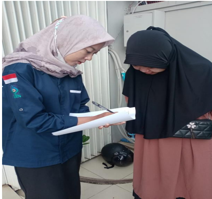
Pengisian kuesioner oleh responden nasabah Bank Syariah Indonesia KCP Kotabaru