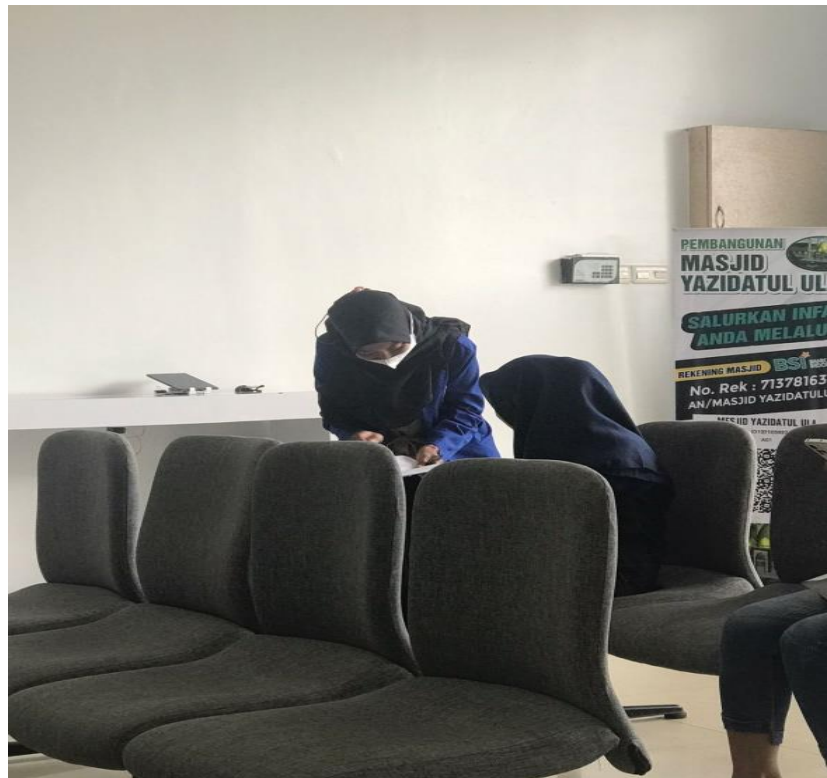
Pengisian kuesioner oleh responden nasabah Bank Syariah Indonesia KCP Kotabaru