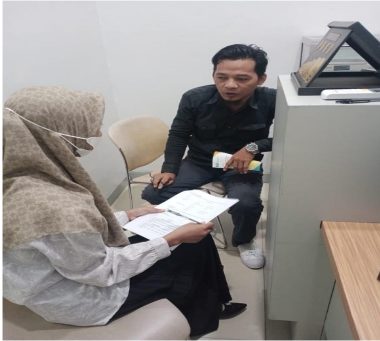
Pengisian kuesioner oleh responden nasabah Bank Syariah Indonesia KCP Kotabaru