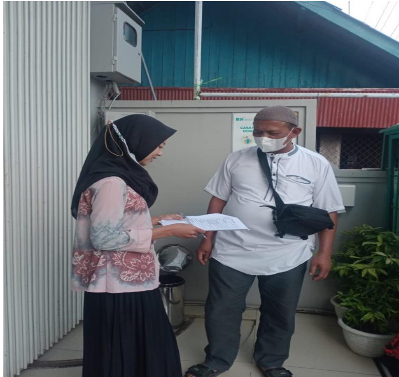
Pengisian kuesioner oleh responden nasabah Bank Syariah Indonesia KCP Kotabaru