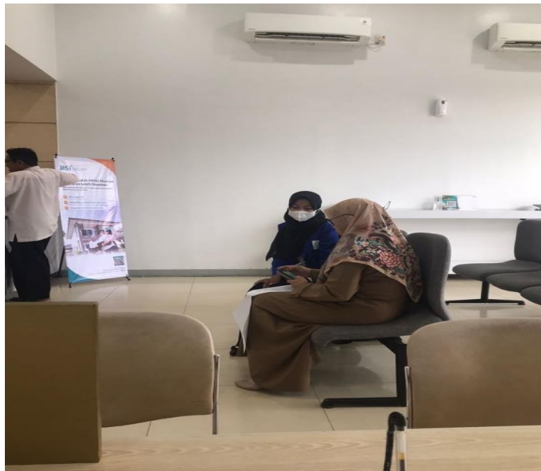
Pengisian kuesioner oleh responden nasabah Bank Syariah Indonesia KCP Kotabaru