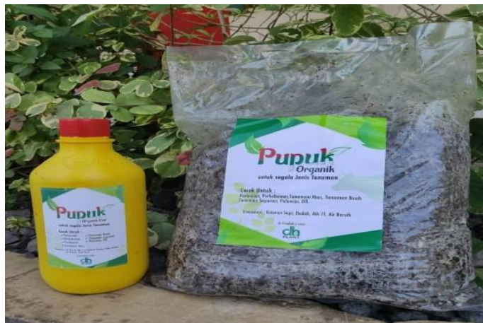
Gambar 4.4 Kegiatan Santri Memilah Sampah Dan Pupuk Hasil Pemanfaatan Sampah