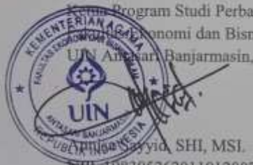
UIN Antasari Banjarmasin NIP. 198305262011012007

Ketua Program Studi Perbankan Syariah Fakultas Ekonomi dan Bisnis Islam UIN Antasari Banjarmasin,