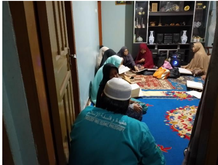
Kegiatan Pengajian Yasinan