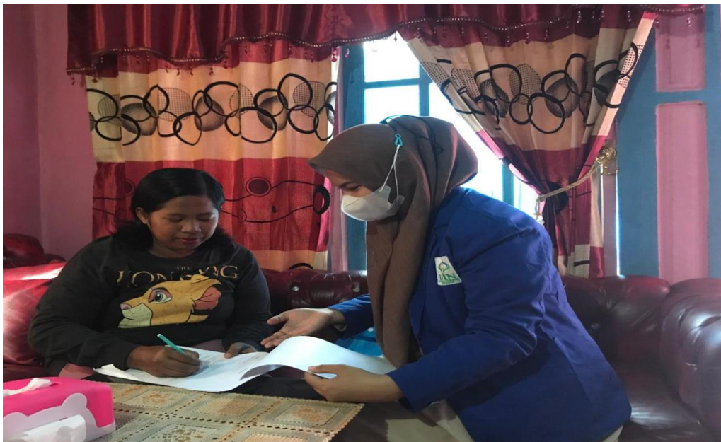
Dokumentasi pembagian angket kepada nasabah Bank Sinarmas Syariah Kcs Banjarmasin