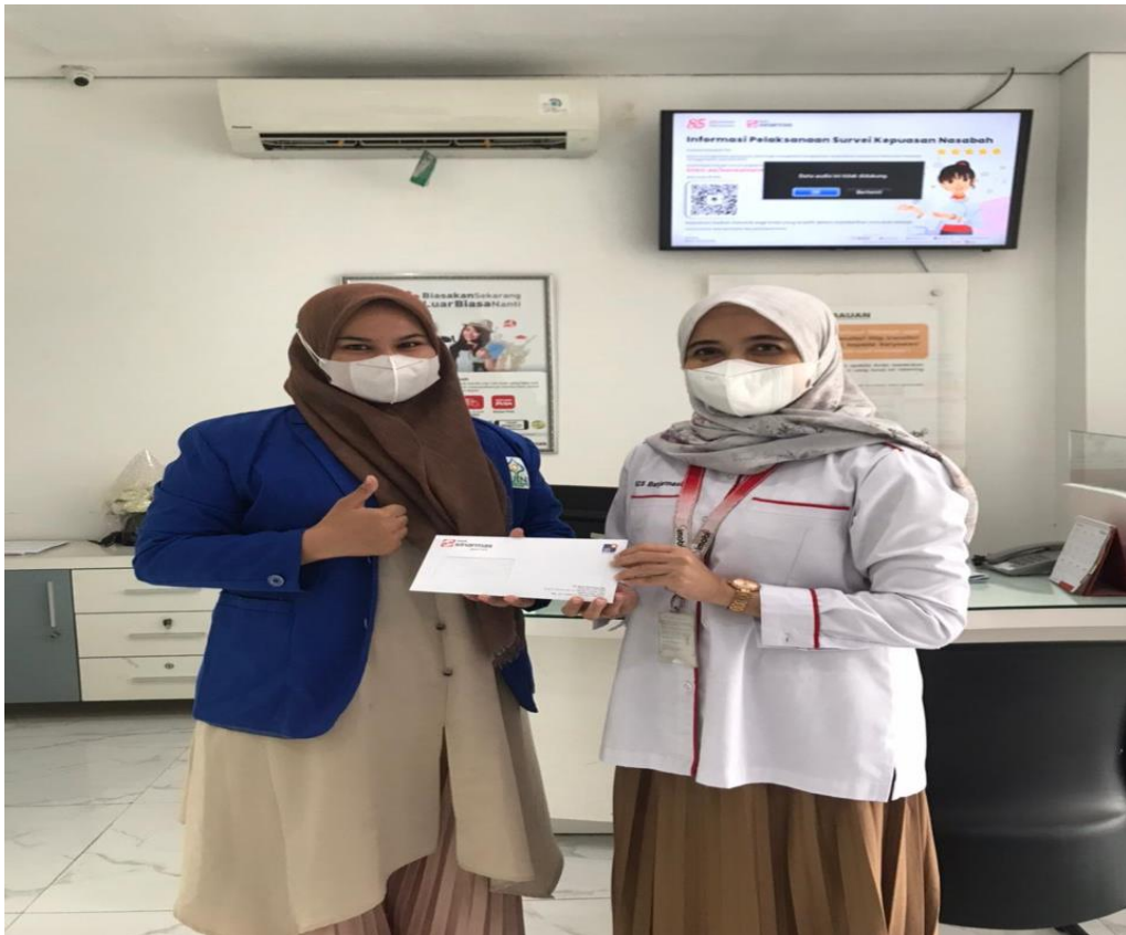
Dokumentasi bersama karyawan Bank Sinarmas Syariah Kcs Banjarmasin