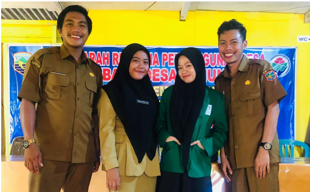
Keterangan: Swafoto Bersama Perangkat Desa Tanjung Samalantakan Setelah Melakukan Wawancara. 2 Agustus 2023.