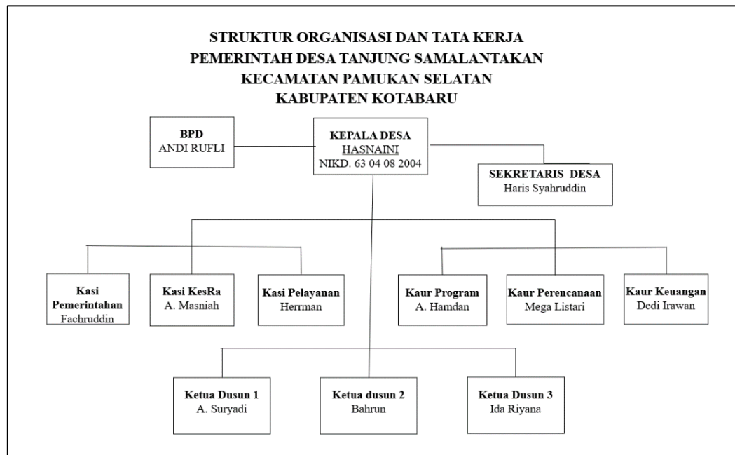
Gambar 4.2 Struktur Organisasi Pemerintahan Desa

Desa Tanjung Samalantakan menganut Sistem Kelembagaan Pemerintahan Desa dengan Pola Minimal, selengkapnya sebagai berikut :