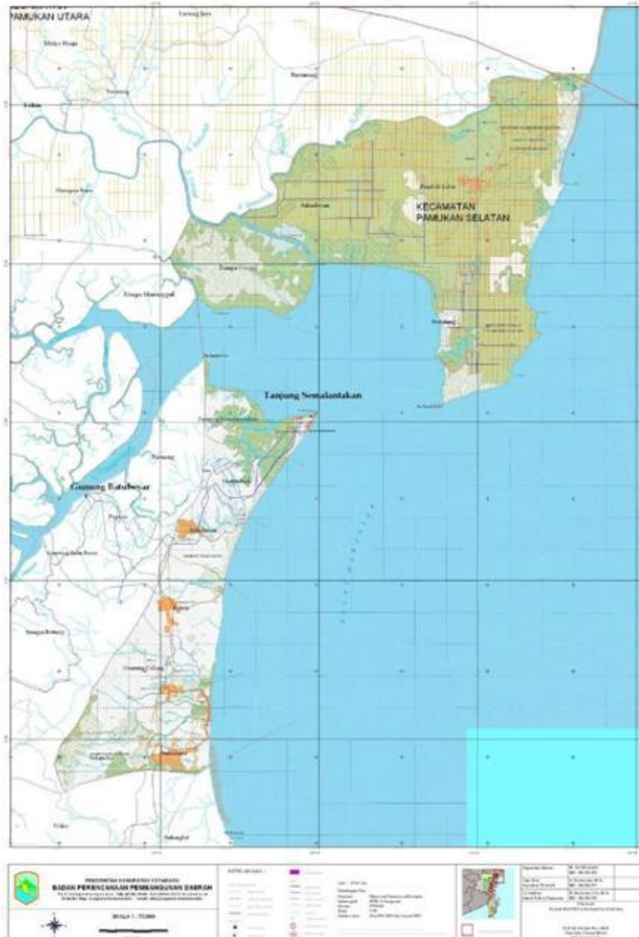
Gambar 4.1 Peta Wilayah Pamukan Selatan

Desa Tanjung Samalantakan merupakan salah satu dari beberapa desa di Kabupaten Kotabaru dan merupakan pusat atau Ibu Kota dari Kecamatan Pamukan Selatan. Desa Tanjung Samalantakan sendiri memiliki luas wilayah ±