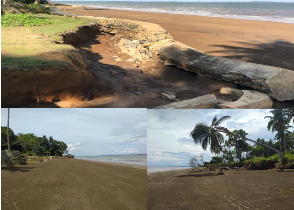
Gambar 4.3 Pantai Teluk Pamukan (Dokumentasi Pribadi)