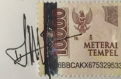
Jihan Nafisah Efendy

Banjarmasin, 2 Agustus 2023 Yang membuat pernyataan