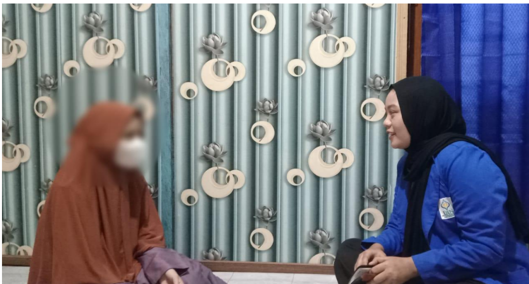
Wawancara bersama Informan 6