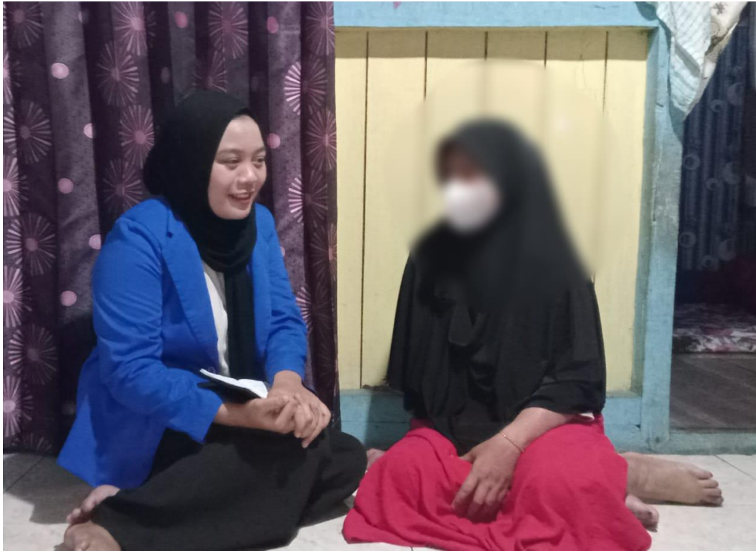
Wawancara bersama Informan 5