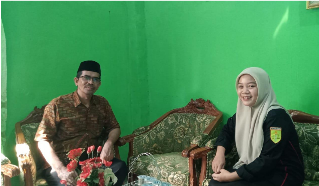
Wawancara bersama Kepala KUA Kecamatan Kelua