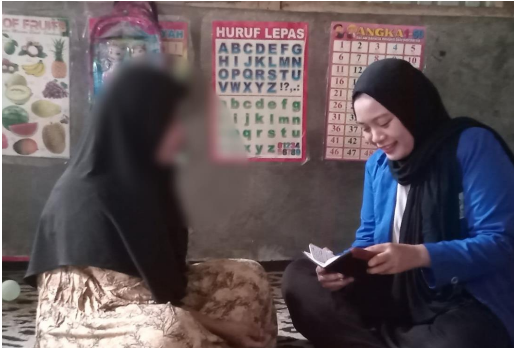
Wawancara bersama Informan 1