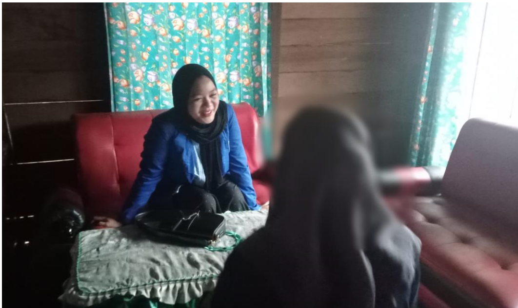
Wawancara bersama Informan 4