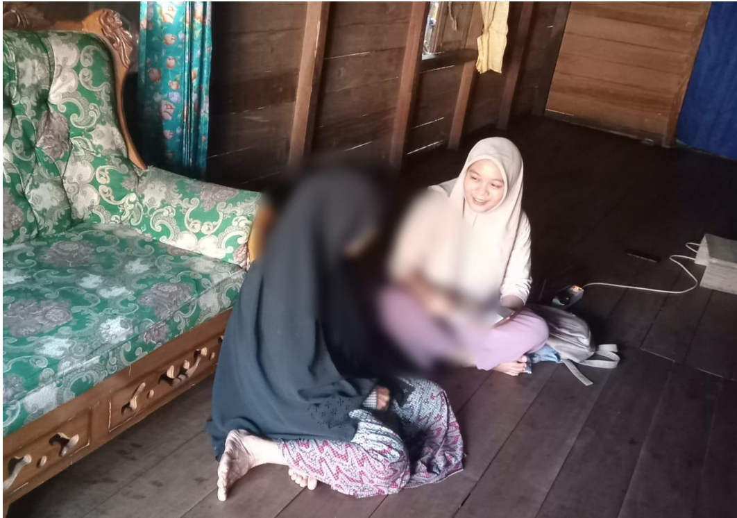
Wawancara bersama Informan 3