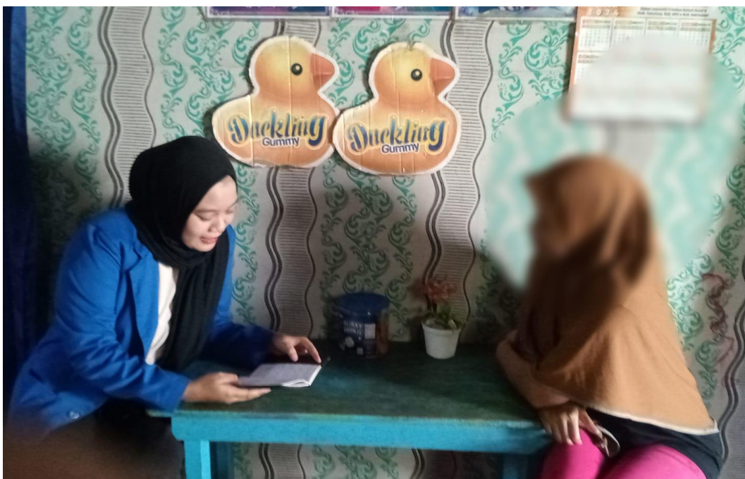
Wawancara bersama Informan 2