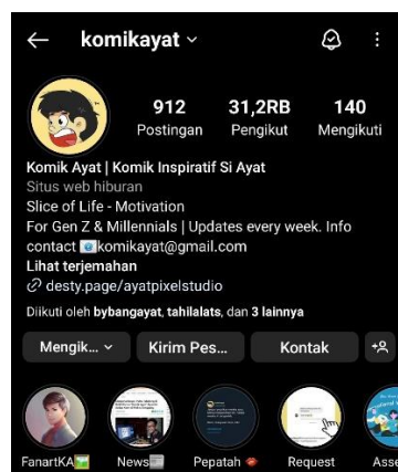
Gambar 1. 2 Profil Akun Instagram @Komikayat

Ilustrasi komik dapat digunakan sebagai sarana untuk menyampaikan pesan islami kepada masyarakat luas melalui instagram. Platform ini dapat menjadi wadah bagi siapapun untuk menyampaikan pesan-pesan dakwah dengan cara yang lebih modern.