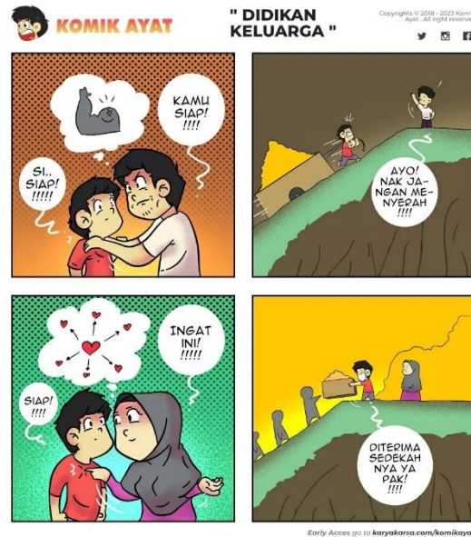
Gambar 1. 3 Salah satu komik yang diunggah Komikayat

komik untuk menyampaikan pesan-pesan dakwah yang beragam, mulai dari Akidah, akhlak, syariah, hingga isu-isu populer yang ada di dunia.