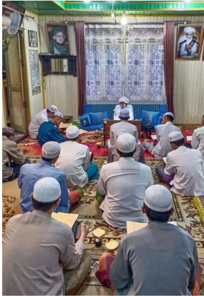
Suasana Majelis Taklim Ittihâdu Adz-Dzâkirîn – Jumat, 11 Agustus 2023