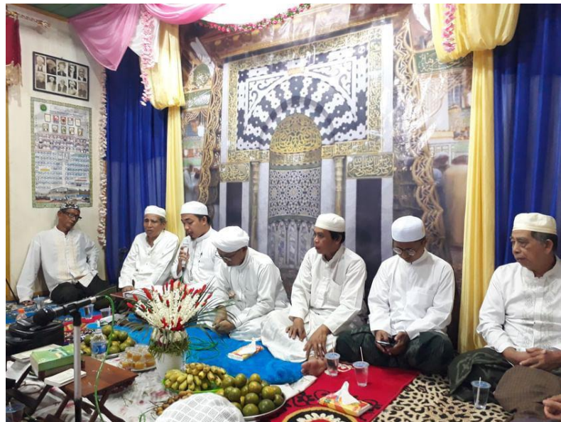
Kegiatan Rutin Maulid Al-Habsyi – Kamis, 7 September 2023