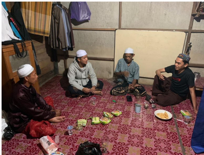
Wawancara dengan Santri Pondok Pesantren Darussalam – Kamis, 10 Agustus 2023