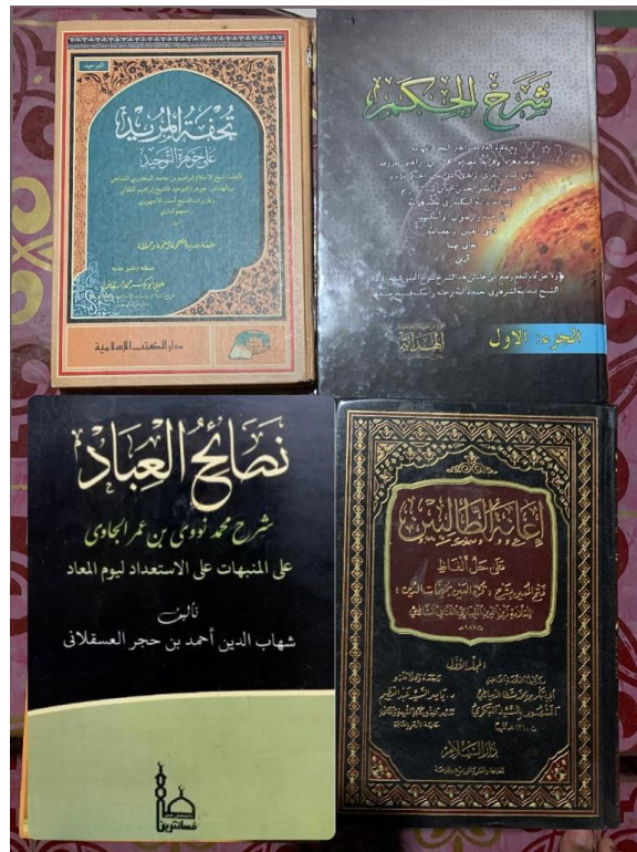
Kitab-kitab kajian di Majelis Taklim Ittihâdu Adz-Dzâkirîn – Kamis, 24 Agustus 2023