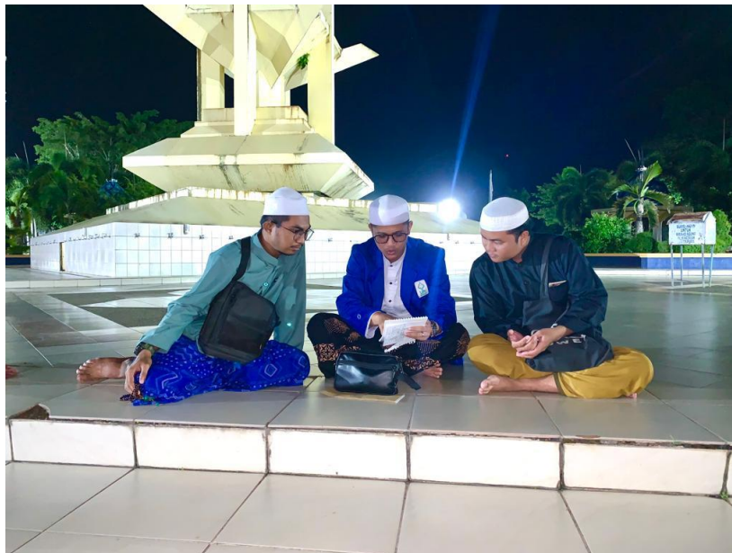
Wawancara dengan Jamaah Majelis Masjid Agung Al-Karomah Martapura – Kamis, 10 Agustus 2023