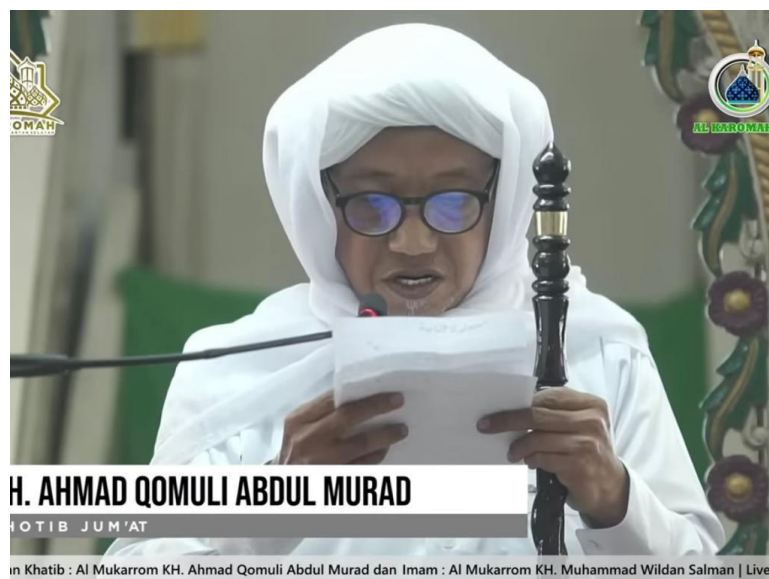
Khotbah Masjid Agung Al-Karomah Martapura – Jum'at, 8 September 2023