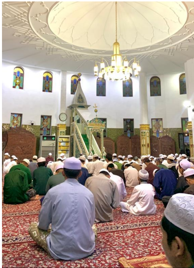
Suasana Majelis Taklim Masjid Agung Al-Karomah Martapura – Jumat, 11 Agustus 2023