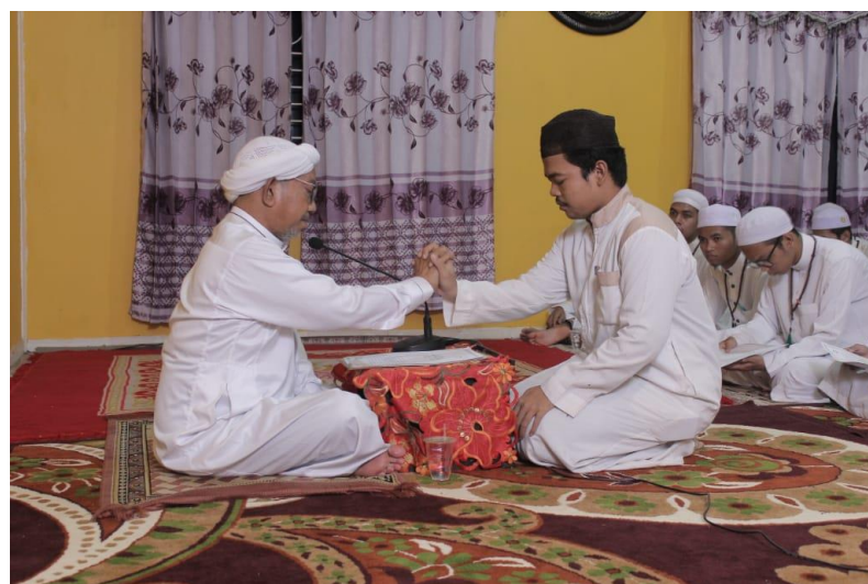
Suasana Bimbingan Talqin Dzikir – Kamis, 10 Agustus 2023