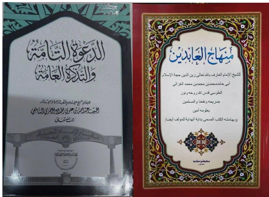
Kitab-kitab kajian di Majelis Taklim Masjid Agung Al-Karomah Martapura – Kamis, 24 Agustus 2023