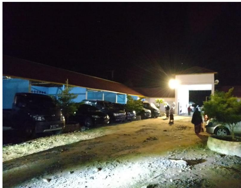
Tempat Parkir Roda 4