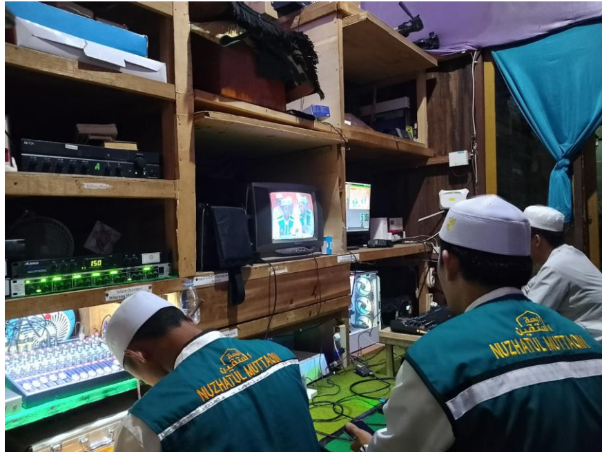
Ruangan Sound System