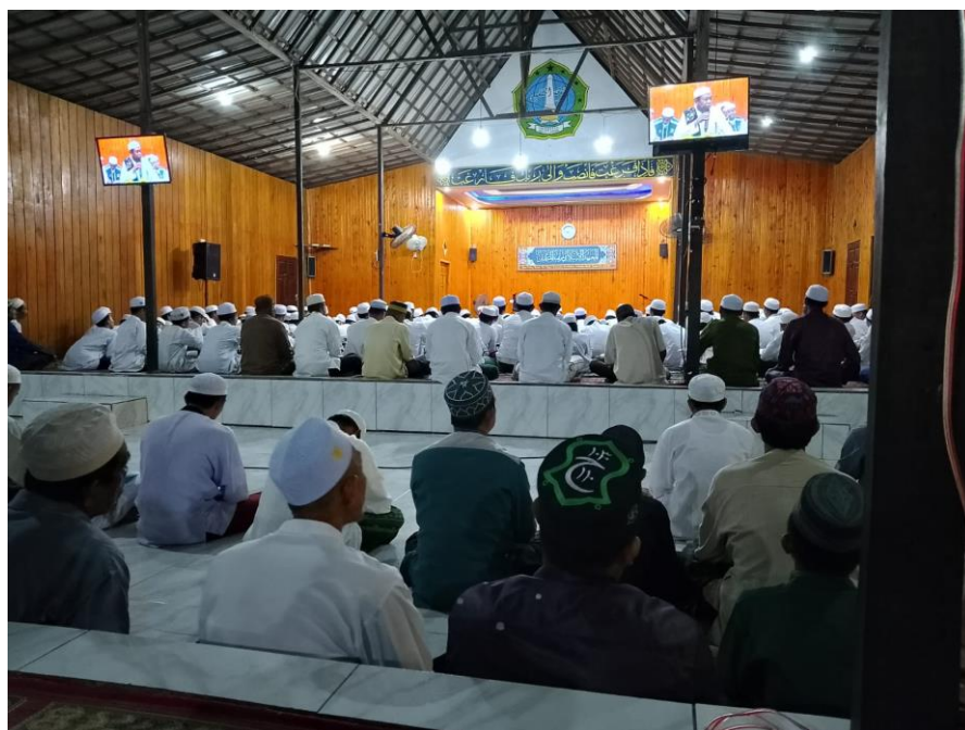
Dokumentasi Jama'ah ketika pengajian