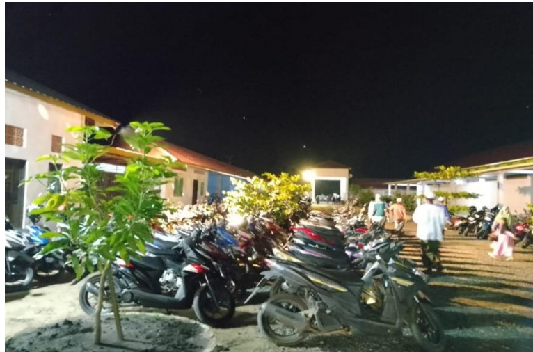
Tempat Parkir Roda 2