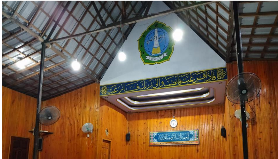
Gambar 4. 3 Tempat MT. PP Nuzhatul Muttaqin