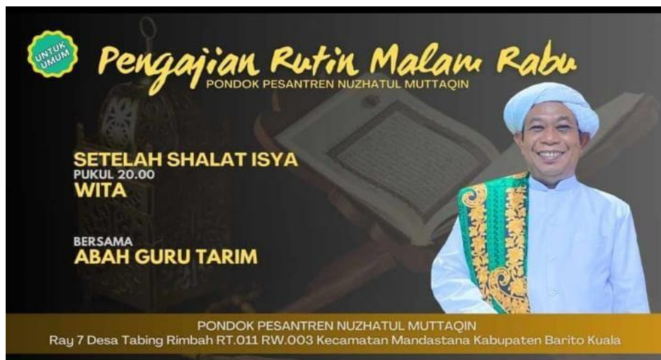
Gambar 4. 7 Template Kegiatan MT. PP Nuzhatul Muttaqin