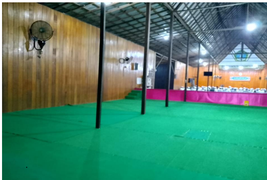
Gambar 4. 4 Tempat MT. PP Nuzhatul Muttaqin