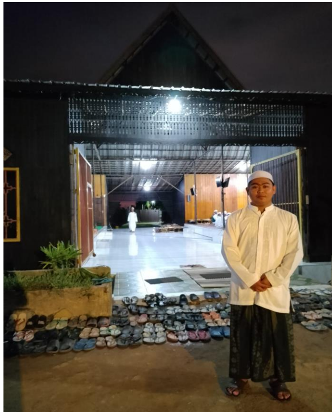
Gambar 4. 10 Peneliti Hadir MT. PP Nuzhatul Muttaqin