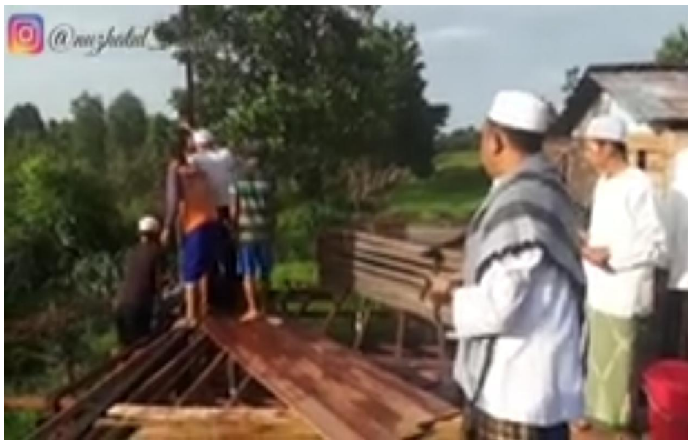
Gambar 4. 2 Pendirian Tiang Pertama MT. PP Nuzhatul Muttaqin

Mejelis Taklim K. H. Muhamad Amin Shamad (Guru Tarim) adalah lembaga pendidikan non-formal. Didirikan pada tanggal 24 April 2019 M bertepatan 18 Sya'ban 1440 H seiring nya berdiri Pondok Pesantren Nuzhatul Muttaqin, yang ditandai dengan pendirian tiang pertama bangunan Pondok Pesantren Nuzhatul Muttaqin. 1