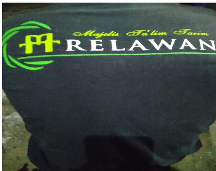
Gambar 4.1 5 Baju Relawan MT. PP Nuzhatul Muttaqin

yang mana Ustadz dan Ustadzah serta Santri dan Santriwati nya lah yang membantu akan keberlangsungan kegiatan Majelis Taklim tersebut.