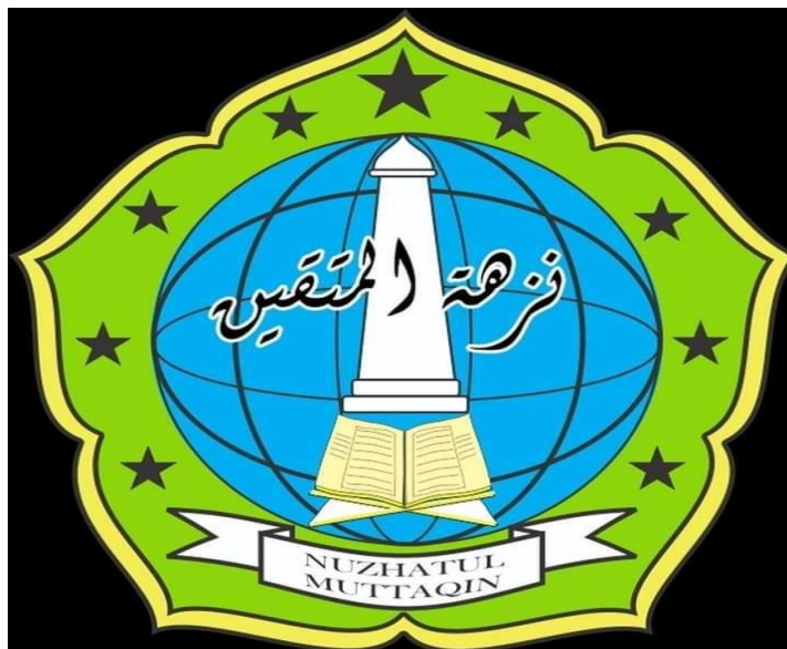
Gambar 4. 8 Logo PP. Nuzhatul Muttaqin

namun kerana Majelis Taklim tersebut berada didalam lingkungan Pondok Pesantren Nuzhatul Muttaqi, maka sudah termasuk dalam bagian Pondok. Kerena Pondok dan Majelis Taklim adalah satu kesatuan. Berikut adalah gambar logo Pondok Pesantren Nuzhatul Muttaqin :