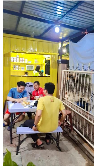
Gambar 2: Stand dan tempat santai Roti bakar pastry twins.

Meskipun pada Roti Bakar Pastry Twins lokasi yang kurang strategis bukan ditempat umum bahkan dirumah dan komplek jalan buntu akan tetapi masih mampu bertahan hingga 4 tahun sampai sekarang dengan omset perbulan 5 sampai 6 juta perbulan, berkat digital marketing menggunakan sejak Juli 2021 dan bahkan pemilik menjelaskan bahwa pelanggan 90% berasal dari GrabFood ShopeFood dan GoFood, seandainya tidak ada digital marketing maka usaha Roti Bakar Pastry bisa saja bertahan kurang 2 bulan.