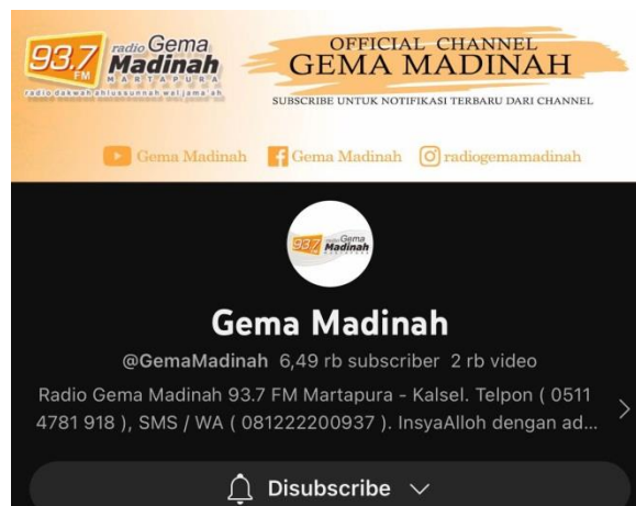
Gambar 1.2 Profil akun YouTube Gema Madinah

streaming, Gema Madinah dapat merekam dan mengarsipkan konten dakwah untuk ditonton kembali oleh audiens di masa depan. Selain itu, dengan menggunakan live streaming YouTube, Gema Madinah dapat menyajikan konten yang beragam dan bervariasi, seperti ceramah, tanya jawab, dan diskusi panel. Ini memungkinkan mereka untuk menjangkau berbagai jenis audiens yang memiliki preferensi dan kebutuhan yang berbeda. Channel YouTube Gema Madinah dibuat pada tanggal 16 November 2013. Channel YouTube ini berisikan kajian-kajian dakwah dari Ustadz-ustadz Ahlussunah Wal Jama'ah yang bersumber dari Al-Quran dan As-Sunnah.