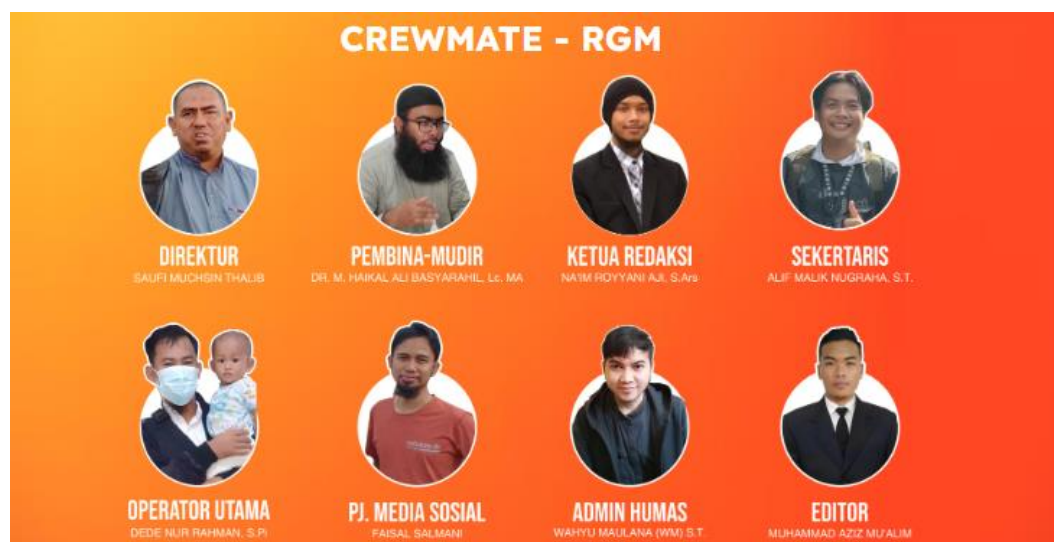
Gambar 4.2 Crew Gema Madinah