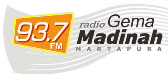
Gambar 4.1 Logo Gema Madinah

Setelah disusunnya akte pendirian perusahaan kemudian mulai dilakukan semua tahap proses perizinan. Izin prinsip penyelenggaraan penyiaran ISR di Frekuensi 93,7 FM. Porsi utama yang selalu menjadi unggulan dan dikedepankan Radio gema madinah 93,7 FM Martapura adalah bukan menyajikan kepentingan bisnis semata tetapi khusus untuk kegiatan dakwah islamiyah dan lebih mengutamakan sisi moral, akhlak yang baik serta pendidikan, dialog interaktif dan pemahaman salafus-Shalih.