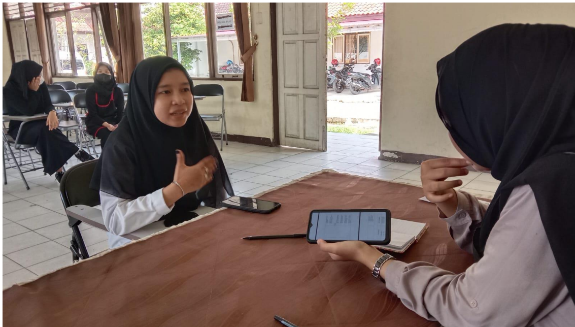
Wawancara 21 November 2022