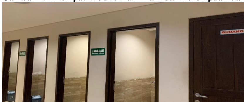
Gambar 4. 4 Tempat Wudhu Laki-Laki dan Perempuan dan Toilet

Tempat wudhu di Masjid Agung Al-Falah ini sangat menarik. Saat pertama kali masuk dari depan terdapat tangga utama masjid, namun jika ingin menuju tempat wudhu terdapat pintu di samping tangga utama. Saat masuk, langsung berhadapan dengan loket tempat penyimpanan alas kaki (sandal/sepatu). Setelah itu untuk menuju tempat wudhu dan toilet harus melewati lorong yang panjang, menuju lorong itu di sampingnya terdapat kipas angin yang menempel di dinding. Fasilitas wudhu di Masjid Agung Al-Falah ini sangat mendukung sehingga masyarakat nyaman saat datang ke masjid ini.