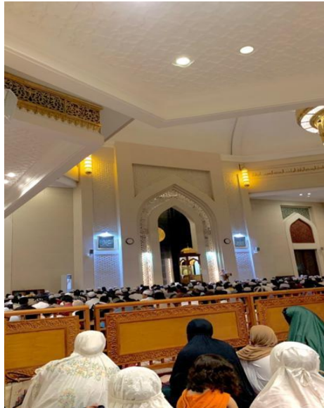
Gambar 4. 9 Pelaksanaan Kegiatan Salat Tarawih