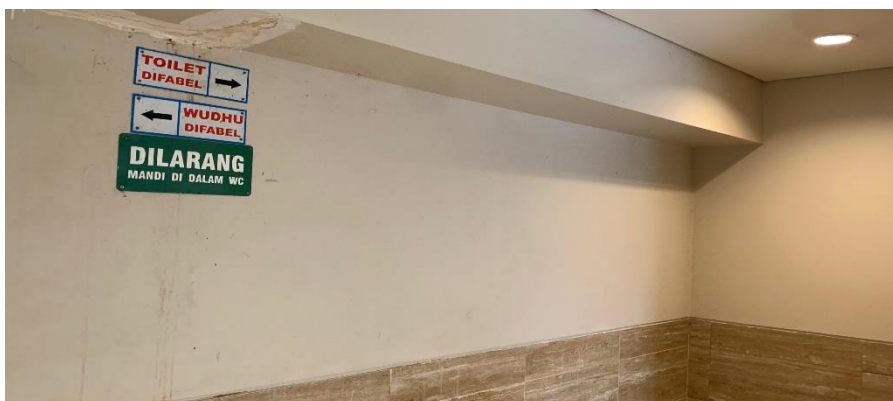
Gambar 4. 5 Toilet dan Tempat Wudhu Khusus Difabel

Toilet dan tempat wudhu khusus difabel ini sama seperti toilet pada umumnya, namun penempatannya sangat dekat dengan pintu masuk dan penempatan alas kaki, sehingga sangat mempermudah akses mereka.