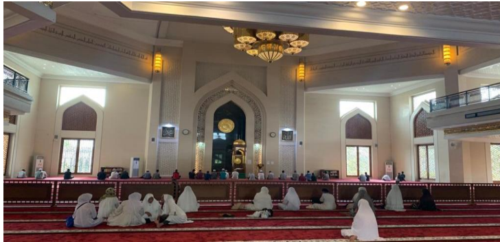
Gambar 4. 7 Salat Lima Waktu

bahkan pejabat. Begitu pula dengan jamaah yang bukan merupakan warga sekitar masjid namun juga berasal dari luar kota dan provinsi, yang tujuannya biasanya berwisata dan ziarah kemudian singgah sejenak di masjid terlebih dahulu sebelum melanjutkan perjalanan.