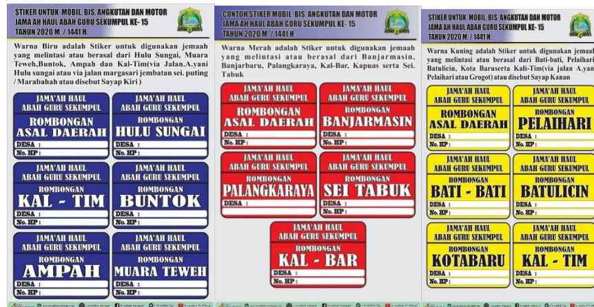
Gambar 4.2 Stiker Kendaraan Jemaah Haul