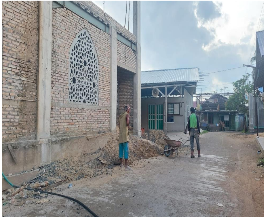
Sumber: Dokumentasi Peneliti