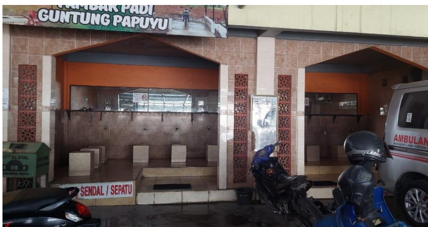
GAMBAR 4.6 Tempat wudhu Masjid Nurul Qamar