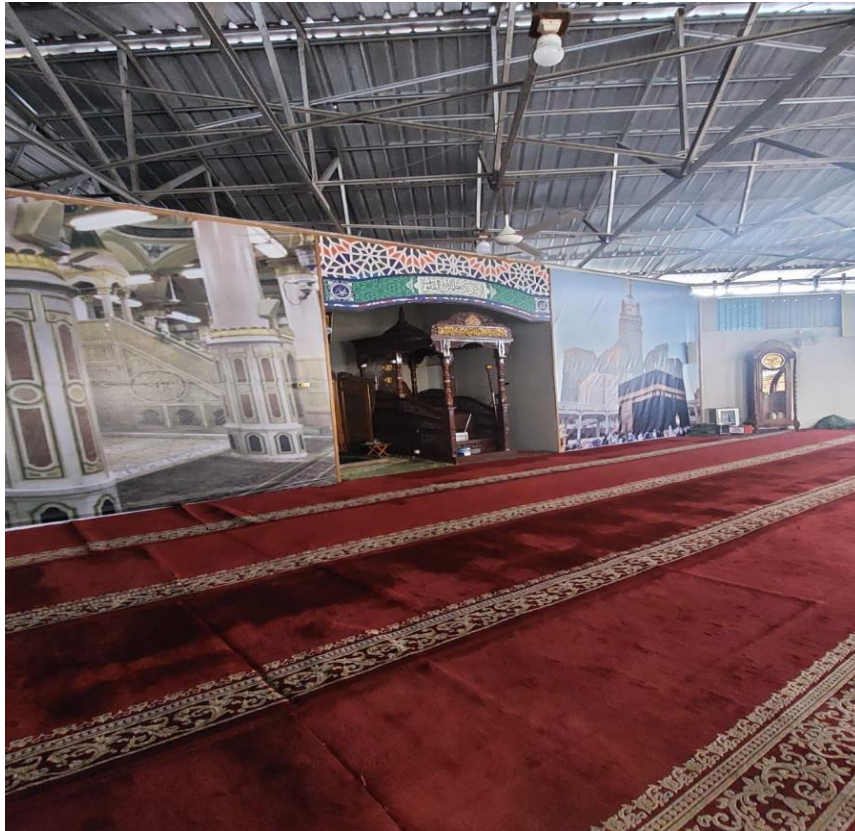
GAMBAR 4.4 Ruang Induk Masjid Nurul Qamar Sementara