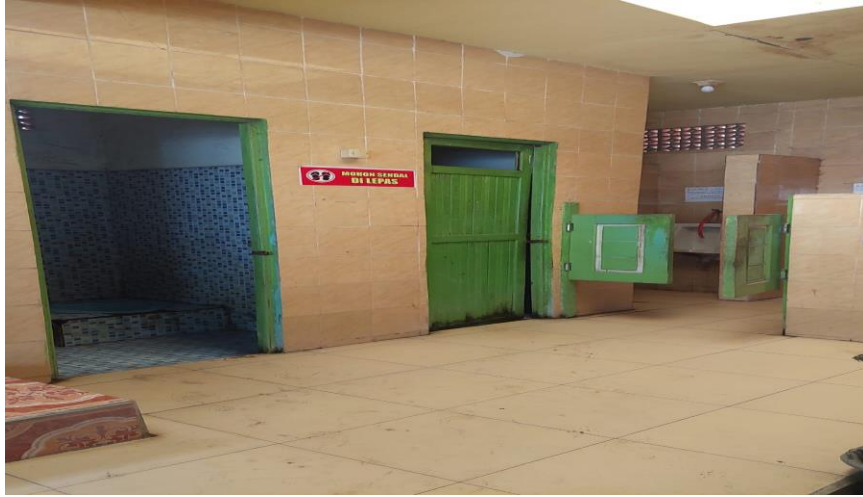
GAMBAR 4.7 Toilet dan kamar mandi Masjid Nurul Qamar