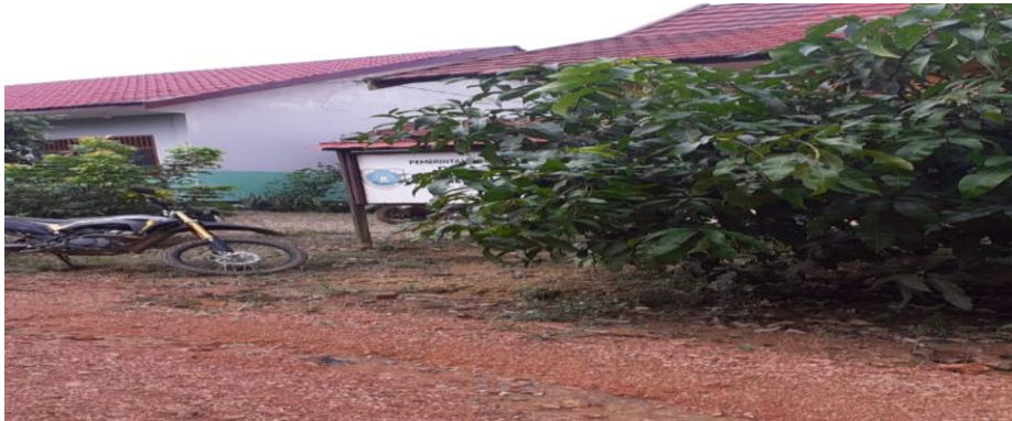
Picture 1. Request permission to conduct research