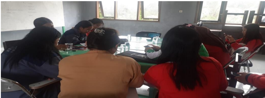
Picture 5. The students was editing vlogs