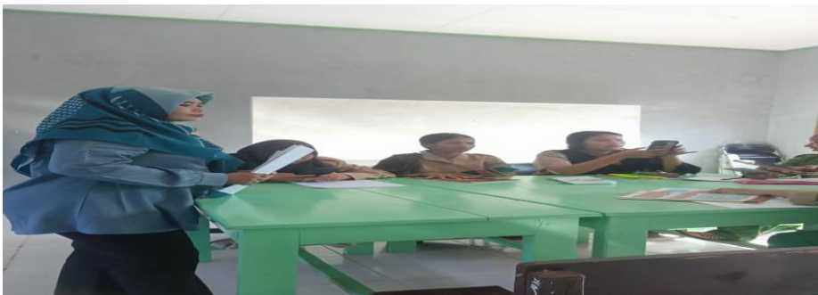
Picture 2. The teacher explain design project