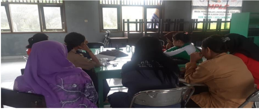
Picture 4. The teacher monitors students in working on project