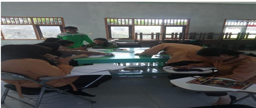
Picture 3. The students carry out project discussions in groups