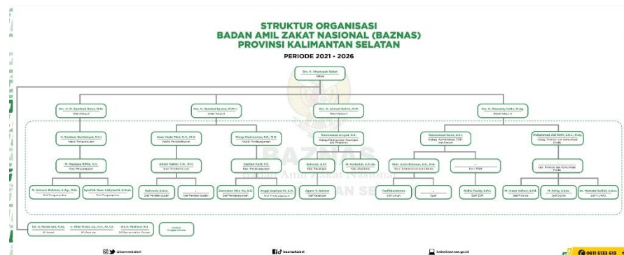
Gambar 4. 1 Struktur Oragnisasi BAZNAS Provinsi Kalimantan Selatan