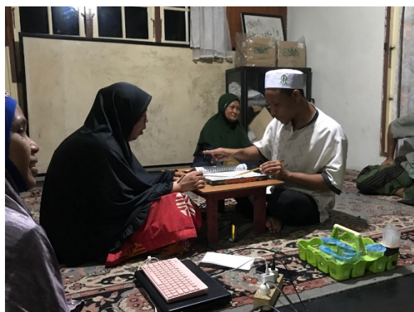
Proses bimbingan membaca al-Qur'an oleh masing-masing individu