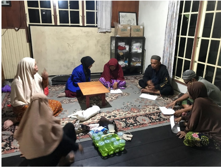
Proses pengisian angket oleh para penyandang disabilitas tuli