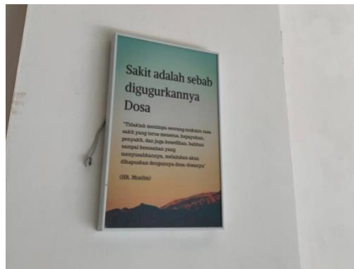
Gambar 4.3 Poster dinding

Bimbingan rohani Islam melalui tulisan meliputi memberikan lembaran artikel yang berisikan doa-doa kesembuhan untuk dibaca oleh pasien, dan poster dinding berupa hadist-hadist yang ditempelkan pada tempat tertentu.