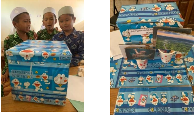
Gambar 4.4 Media Kotak Ajaib

Pernyataan guru mata pelajaran Akidah Akhlak tersebut sesuai dengan hasil observasi yang dilakukan peneliti, materi yang di implementasikan pada model scramble ini adalah materi Asma'ul Husna di kelas V. Materi tersebut telah dianalisis dan dimodifikasi sedemikian rupa oleh guru Akidah Akhlak dengan tambahan foto-foto yang digunakan dalam penyampaian materi dengan media kotak ajaib yang peneliti lihat dari kegiatan observasi dikelas.