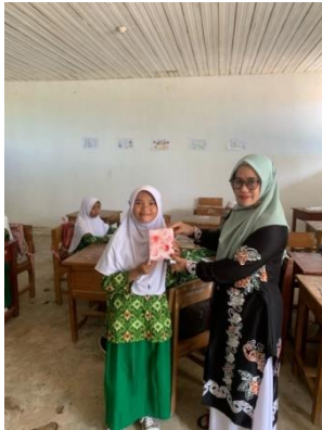
Gambar 4.5 Penyerahan hadiah

Selanjutnya guru bersama peserta didik menyimpulkan materi yang sudah dipelajari dan guru melakukan evaluasi dengan langsung menunjuk peserta didik secara bergiliran untuk ditanyai mengenai materi yang sudah dibahas dan terakhir guru menutup pembelajaran dengan mengucapkan salam.