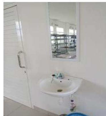
Gambar 4. 5 Wastafel