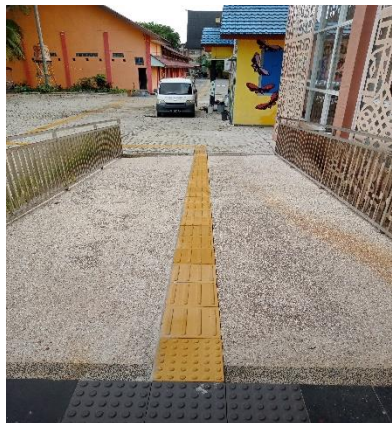
Gambar 4. 2 Guiding Block

Guiding Block yang disebut jalur pemandu buat penyandang disabilitas tunanetra yang di desain khusus. Guiding block berada menuju perpustakaan dan di dalam ruangan perpustakaan untuk memudahkan bagi tunanetra menuju perpustakaan.