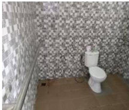
Gambar 4. 6 Toilet

Toilet yang ada di layanan perpustakaan bagi penyandang disabilitas ini telah dirancang khusus buat kebutuhan pemustaka disabilitas berada di dalam gedung layanan yang cukup lebar untuk penyandang disabilitas yang gunakan kursi roda berbalik arah dan juga disediakan pegangan tangan ( handrail ) dengan ketinggian yang sesuai, terdapat wastafel dan cermin di luar toilet dengan ketinggian tepat pemustaka penyandang disabilitas.