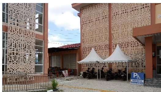
Gambar 4. 4 Area Parkir

Area ini terletak di samping gedung layanan disabilitas yang diberi simbol/tanda pada area parkir dengan ukuran yang cukup aksesibel untuk digunakan khusus pemustaka penyandang disabilitas sebagai memudahkan pemustaka penyandang disabilitas yang berkunjung. Area ini dirancang memadai dengan permukaan lantai yang rata dan mudah dilalui kursi roda atau alat bantu lainnya.