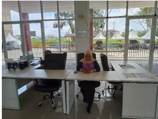
Gambar 4. 7 Meja Sirkulasi

Berdasarkan hasil obeservasi yang dilakukan oleh peneliti yaitu aksesibilitas layanan perpustakaan bagi pemustaka penyandang disabilitas akses fisik yang disebutkan diatas, adapun yang lainnya untuk kondisi di dalam ruangan telah memberikan kenyamanan disediakan locker atau rak simpan tas, lemari katalog, sofa, meja baca, kursi roda dll.