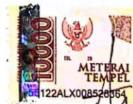
Hafizah Qurratul Ain

Banjarmasin, 05 Maret 2024 Yang membuat pernyataan,