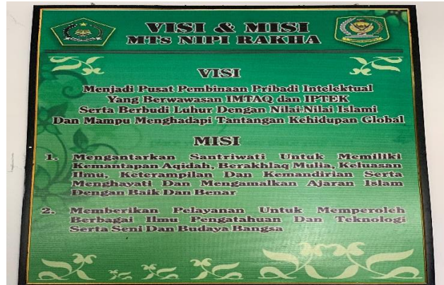
Gambar 4. 1 Gambar Visi dan Misi MTs Normal Islam Putri Rasyidiyah Khalidiyah Amuntai