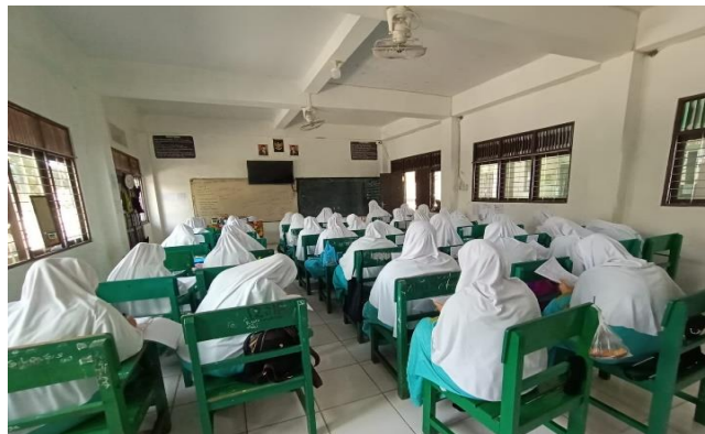
Gambar 4. 3 Proses Belajar Mengajar di Pondok Pesantren Rasyidiyah Khalidiyah Amuntai

Hal ini juga diperkuat dengan observasi peneliti terhadap pembelajaran yang digunakan di pondok pesantren Rasyidiyah Khalidiyah Amuntai bahwa metode yang digunakan dalam pembelajaran pondok meliputi metode klasikal di kelas, diskusi, dan bandongan yang terkadang dilakukan ketika di kelas saat pembelajaran waktu siang hari maupun waktu malam hari. 15