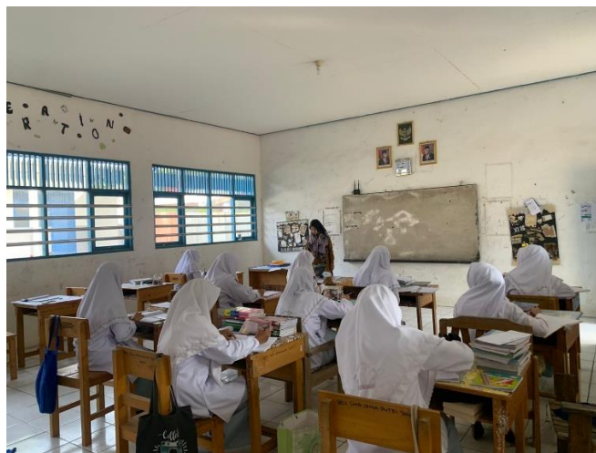
Gambar 4. 5 Proses Belajar Mengajar di Pondok Pesantren Ibnu Atha’ilah Putri Kandangan

Hal ini pun diperkuat dengan hasil observasi peneliti di pondok Pesantren Ibnu Mas’ud Putri Kandangan di kelas 6, salah satu ustazah menyampaikan materi kemudian sembari santriwati memahami dan menulis. Di saat malam hari dan pagi hari menjelang masuk waktu sekolah santriwati terlihat mempelajari pelajaran yang akan datang. 31