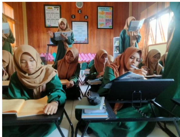
Gambar 4. 6 Pelaksanaan Pembelajaran di Pondok Pesantren Ibnu Atha'illah

Hal ini juga diperkuat dengan hasil observasi dan dokumentasi penulis terhadap pembelajaran pondok pesantren Ibnu Atha'illah Kandangan bahwa metode pembelajaran yang digunakan dalam menyampaikan materi adalah metode sorogan, bandongan, serta hafalan baik itu pembelajaran di kelas pada waktu siang hari ataupun pembelajaran ekstrakurikuler pada waktu malam hari. Metode tambahan untuk meningkatkan kemahiran santriwati dalam pelajaran insya serta pelajaran arabiyah dan juga pandai berbicara bahasa arab dan pelajaran arabiyah adalah metode praktek, dimana santriwati yang berada di kelas 3 Tsanawiyah wajib mengadakan teater ( masrohiyah ), para santrwati mempersiapkan acara tersebut sendiri mulai dari penulisan teks kenario sampai kesiapan panggung. 46