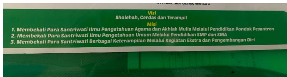
Gambar 4. 4 Visi dan Misi Pondok Pesantren Ibnu Mas'ud Kandangan

Hal ini diperkuat dengan observasi bahwa tujuan kurikulum pondok ialah ingin menjadikan generasi yang mempunyai jiwa pendidik dalam artian lain santriwati yang mempunyai akhlaqulkarimah serta dapat menjadi suri tauladan yang baik di tengah masyarakat. Sebagaimana visi dan misi pondok pesantren. 23