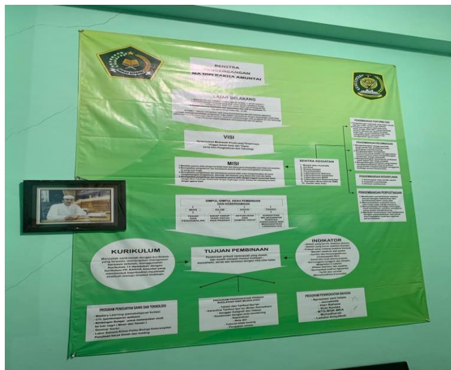
Gambar 4. 2 Gambar Visi dan Misi MA Normal Islam Putri Rasyidiyah Khalidiyah Amuntai