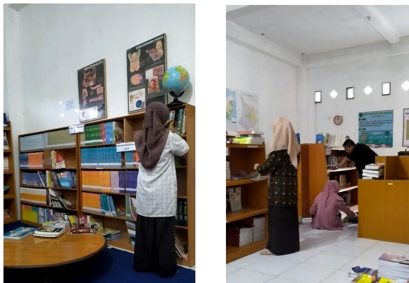
Gambar 6. 2 pelaksanaan stock opname