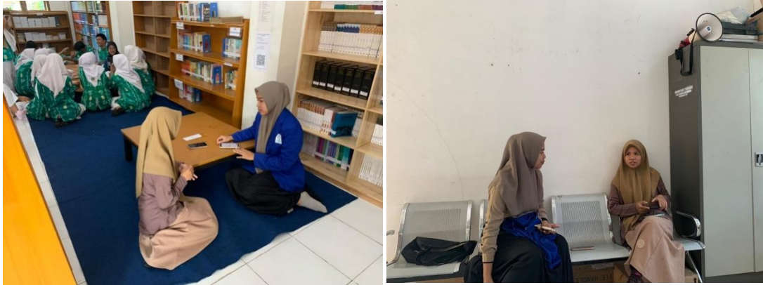
Gambar 6. 1 wawancara bersama narasumber