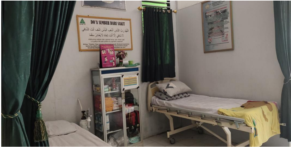
Ruang UKS MAN 1 Hulu Sungai Tengah