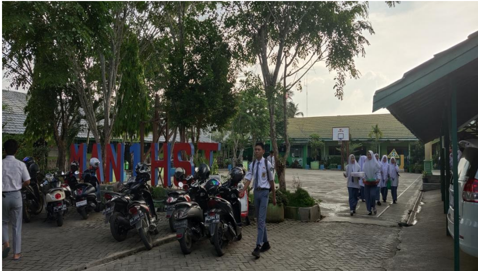
MAN 1 Hulu Sungai Tengah dari dalam