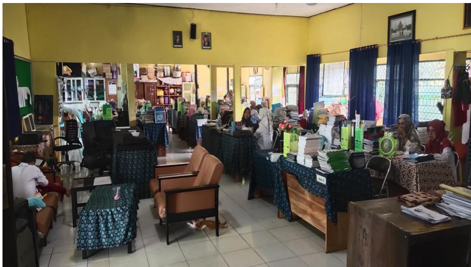
Ruang Guru MAN 1 Hulu Sungai Tengah