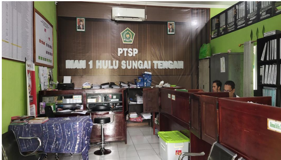
Ruang Tata Usaha MAN 1 Hulu Sungai Tengah