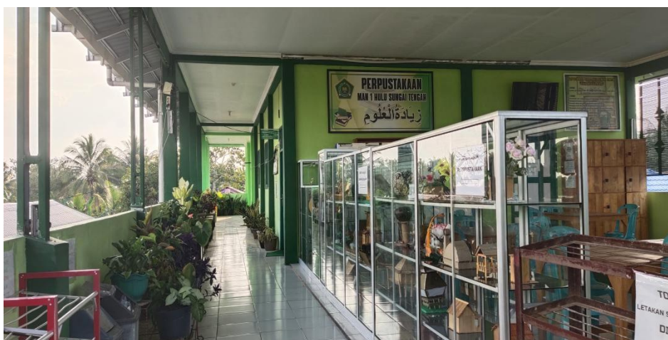
Ruang Perpustakaan MAN 1 Hulu SungainTengah