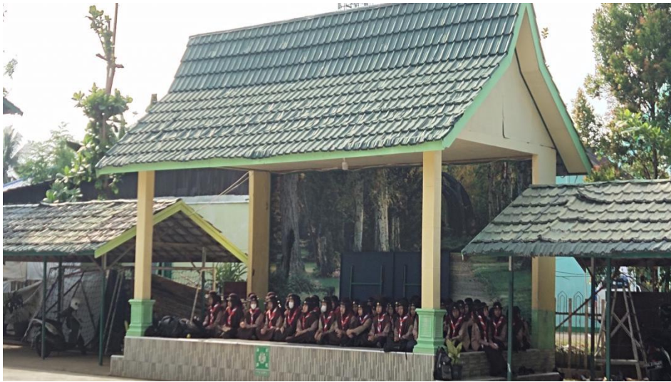
Kegiatan Membaca Sholawat Nariyah Bagi Anggota Pramuka Perempuan MAN 1 Hulu Sungai Tengah yang Berhalangan