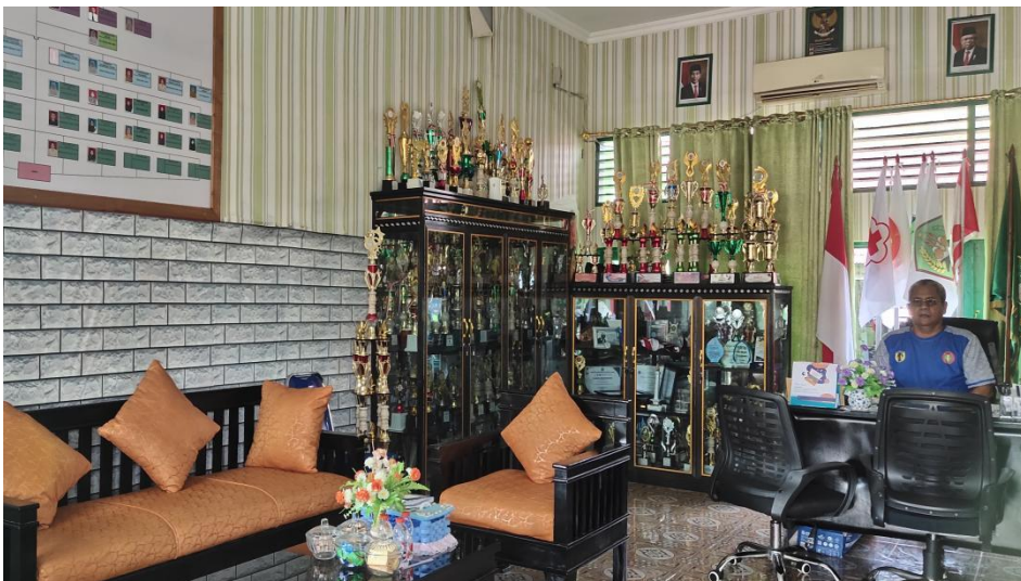
Ruang Kepala Sekolah MAN 1 Hulu Sungai Tengah