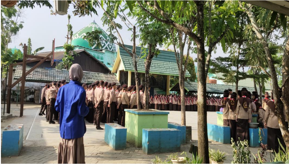
Observasi kegiatan pramuka MAN 1 Hulu Sungai Tengah