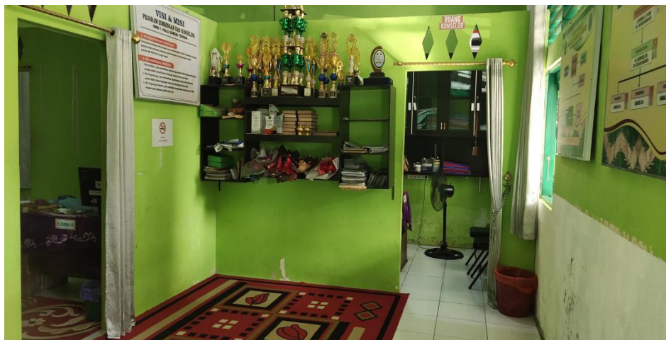
Ruang Bimbingan dan Konseling