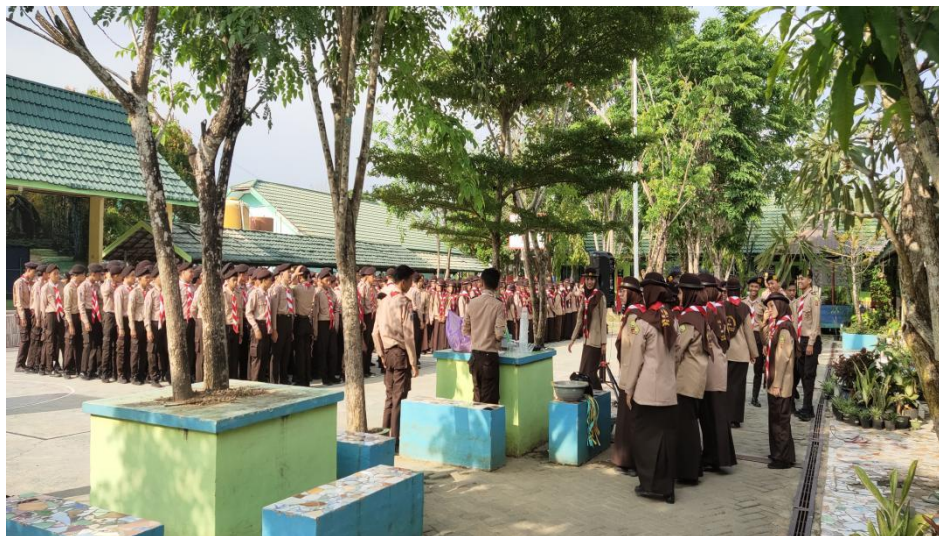
Kegiatan pramuka MAN 1 Hulu Sungai Tengah