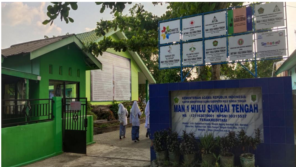
MAN 1 Hulu Sungai Tengah dari depan