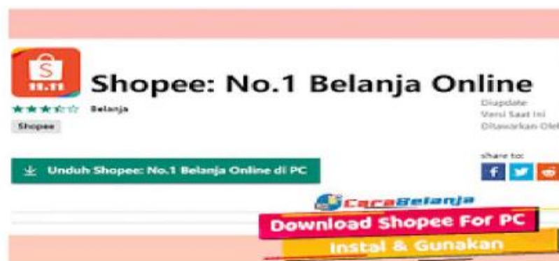
Gambar 1.2 Shopee No. 1 Belanja Online

kebutuhan konsumen maupun produsen, ini tidak lepas bagaimana kita melakukan aktifitas transaksi jual beli online guna memenuhi kebutuhan hidup diri sendiri, mensejahterakan keluarga dan membantu orang lain yang membutuhkan baik berupa pangan, sandang dan papan. Apabila tidak terpenuhi ketiga alasan ini dapat “dipersalahkan” menurut agama.