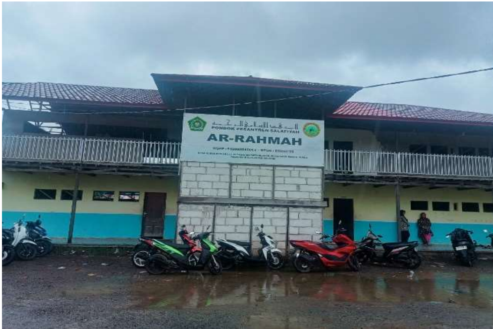
Gambar 4. 1 Lokasi Penelitian Pondok Pesantren Ar-Rahmah