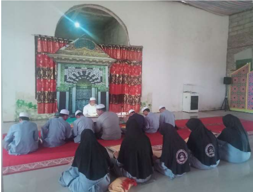
Gambar 4. 3 kegiatan pembelajaran akhlak

Menurut Guru Ahmad Yuni mengatakan bahwa: