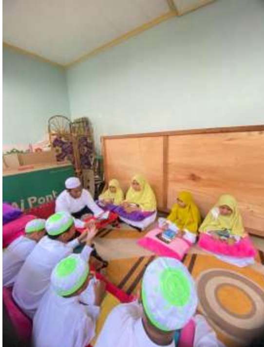
Gambar VI : Kegiatan Pembelajaran Program B Kelompok Ustaz Rizqi