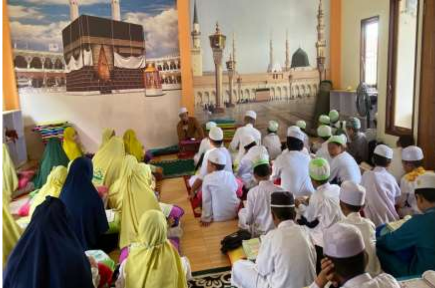
Gambar VIII : Kegiatan Pembelajaran Program C Seni Al-Qur'an