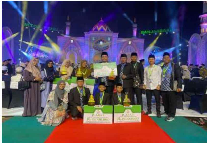
Gambar X : Prestasi Santri dan Pengajar pada Musabaqah Tilawatil Qur'an