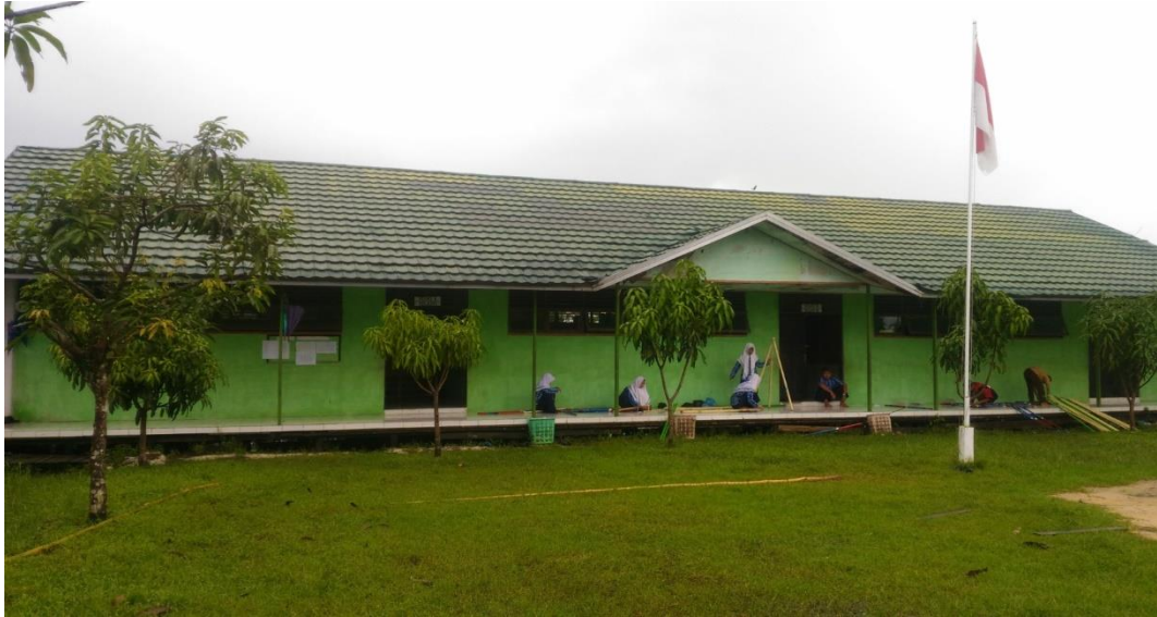
Foto-foto Kegiatan Penelitian di Mts Nurussabah