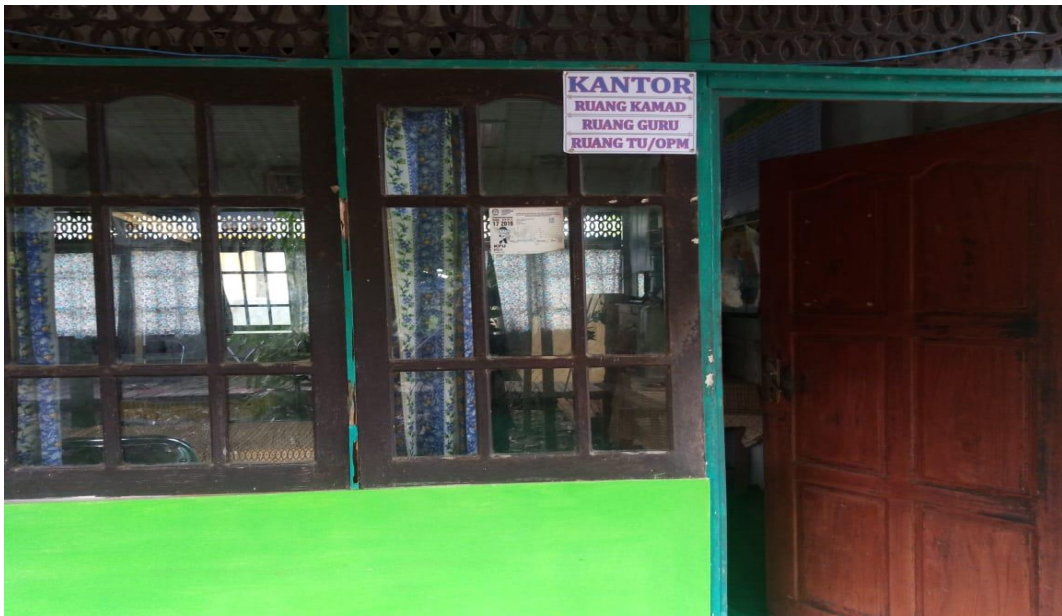
Gambar: 7.2. Kantor Ruang Kamad, Ruang Guru dan Ruang TU