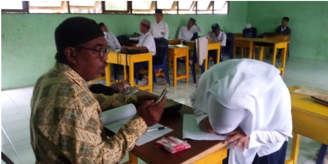
Kegiatan Belajar Mengajar di Kelas ix Mts Nurussabah Sungai Jingah Besar