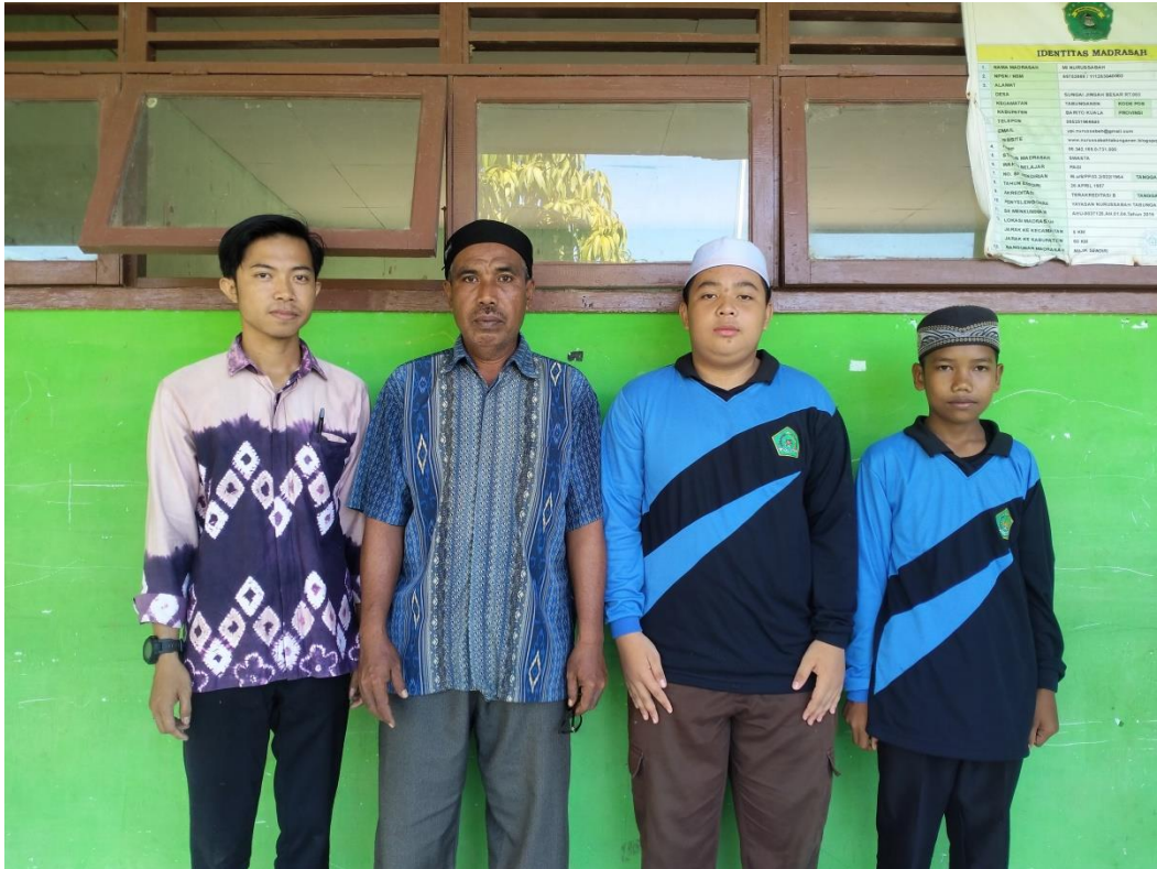
Wawancara dengan Siswa Kelas ix Mts Nurussabah Sungai Jingah Besar