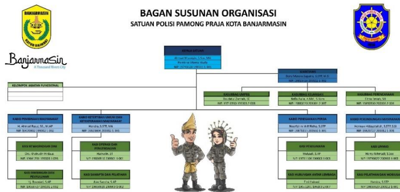
Tabel 4.2 Struktur Organisasi Satuan Polisi Pamong Praja Kota Banjarmasin