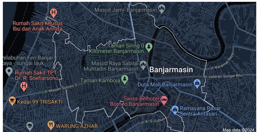
Gambar 4.1 Peta Wilayah Kota Banjarmasin Tengah

jengkol dan kue bingka. Adapun beberapa pedagang yang berjualan kembang di pinggir jalan Ahmad Yani Pasar Sudimampir Baru. 56