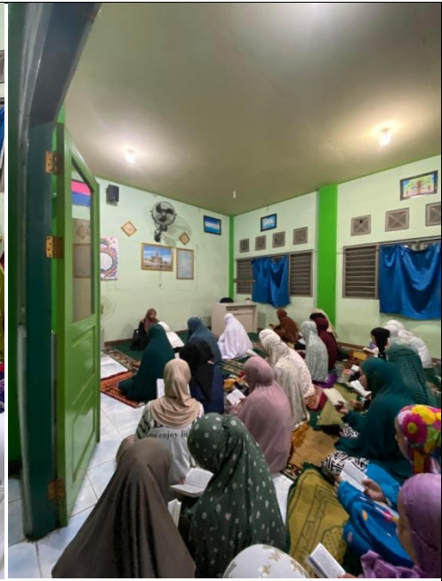
Kegiatan membaca Surah Al-Mulk