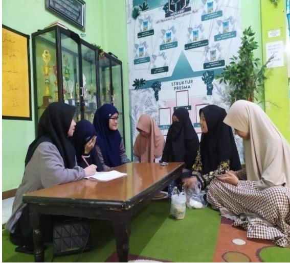
Wawancara bersama musyrifah asrama 1 puteri