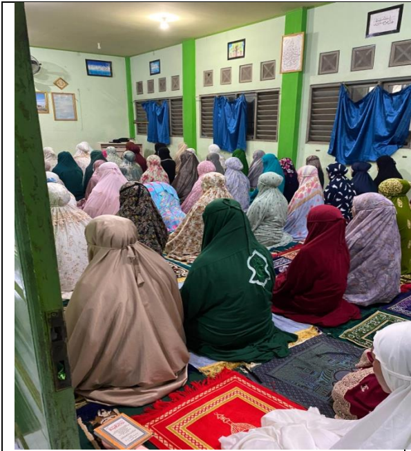
Kegiatan shalat wajib berjamaah