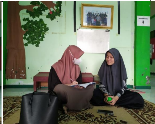
Wawancara dengan Mahasantriwati