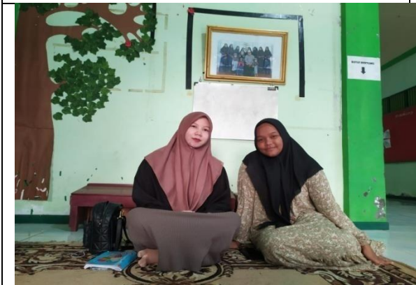
Wawancara dengan Mahasantriwati