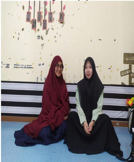
Wawancara dengan musyrifah asrama 2