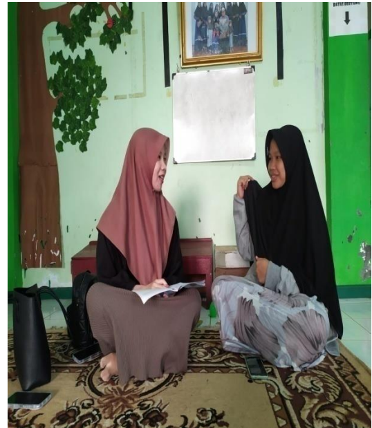
Wawancara dengan musyrifah asrama 3