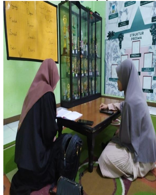
Wawancara dengan musyrifah asrama 1