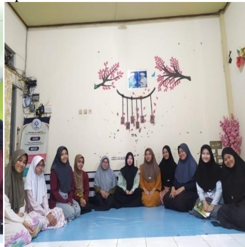
Wawancara mahasantriwati asrama 2 puteri