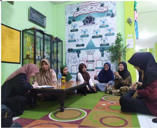
Wawancara bersama mahasantriwati asrama 1 puteri