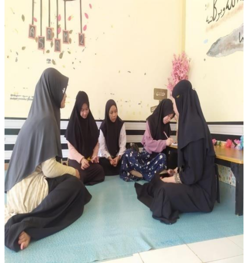
Wawancara mahasantriwati asrama 2 puteri