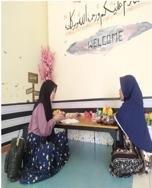
Wawancara dengan musyrifah asrama 2