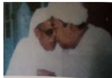
Gambar Karamah ke-62