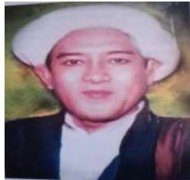
Gambar karamah ke-53