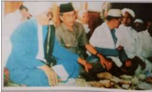
Gambar Karamah ke-69