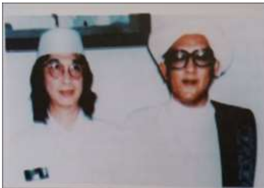
Gambar Karamah ke-84