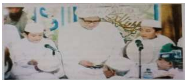
Gambar Karamah ke-26