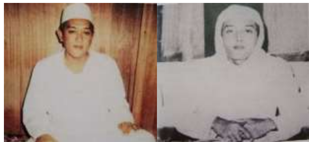
Gambar Karamah ke-22 Gambar Karamah ke-24