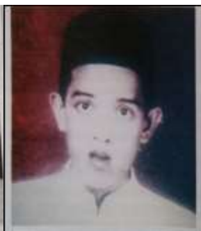
Gambar Karamah ke-5