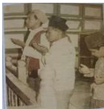
Gambar Karamah ke-38