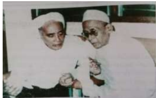
Gambar Karamah ke-14