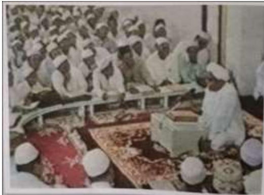
Gambar Karamah ke-82