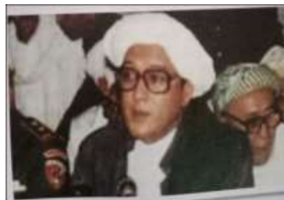
Gambar Karamah ke-90