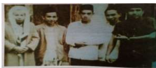
Gambar Karamah ke-36