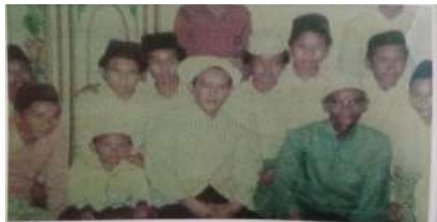
Gambar Karamah ke-31