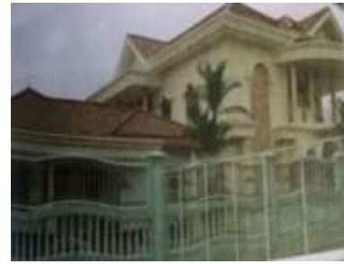
Gambar Karamah ke-59