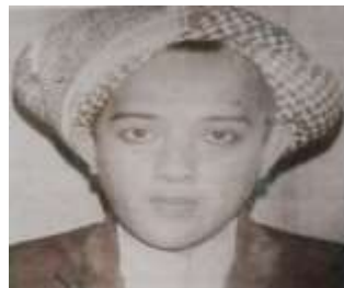
Gambar Karamah ke-15