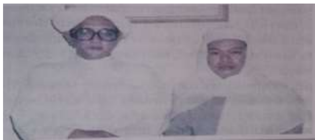
Gambar Karamah ke-63