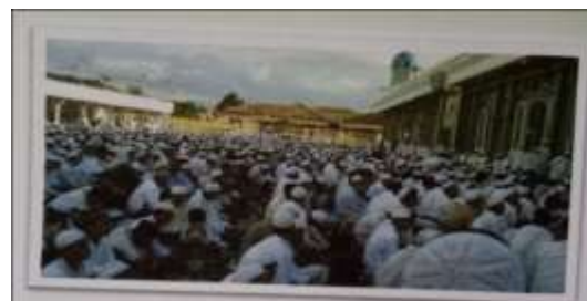
Gambar Karamah ke-100