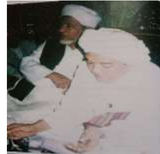
Gambar Karamah ke-29