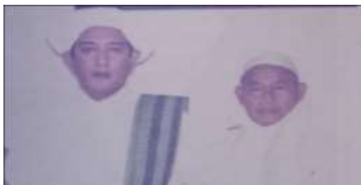
Gambar Karamah ke-56