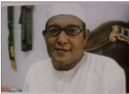
Gambar Karamah ke-73