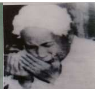
Gambar Karamah ke-11