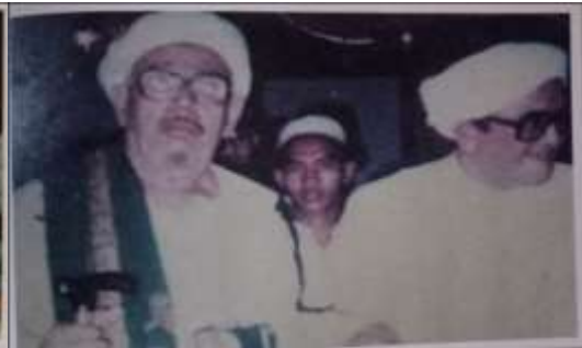
Gambar Karamah ke-72