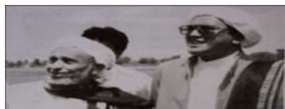
Gambar Karamah ke-68