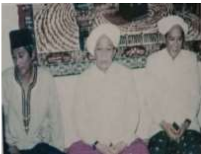
Gambar Karamah ke-30