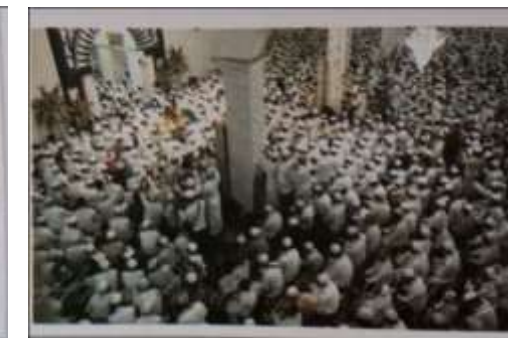
Gambar Karamah ke-87