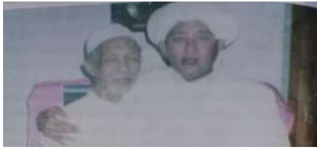
Gambar Karamah ke-58