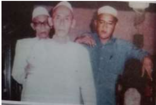
Gambar karamah ke-52