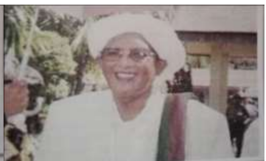
Gambar Karamah ke-81