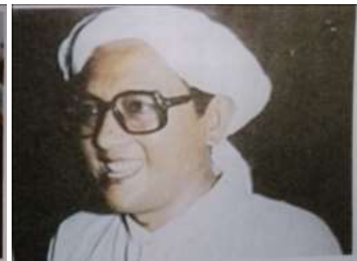
Gambar Karamah ke-74