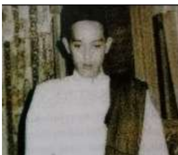
Gambar Karamah ke-8