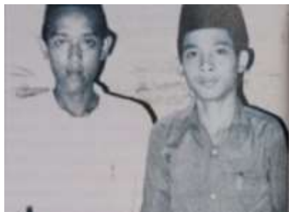
Gambar Karamah ke-21