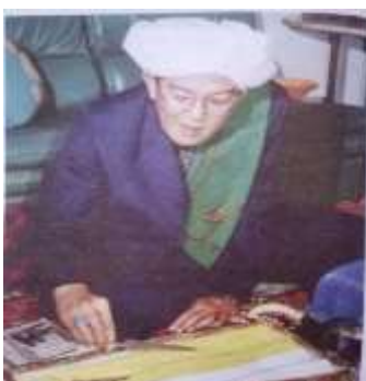
Gambar Karamah ke-56