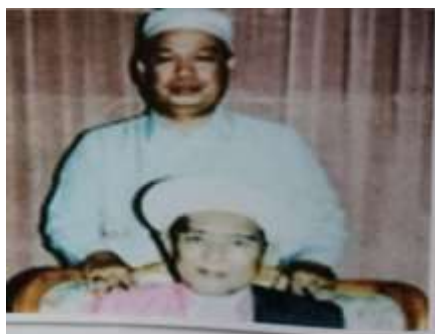
Gambar Karamah ke-64