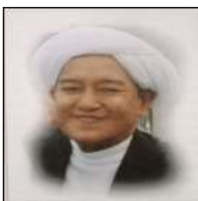
Gambar Karamah ke-89