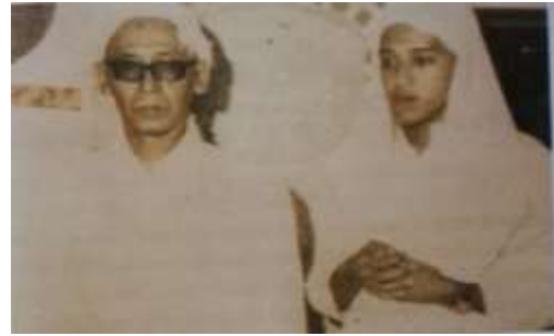
Gambar Karamah ke-19\