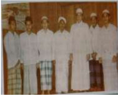
Gambar Karamah ke-27