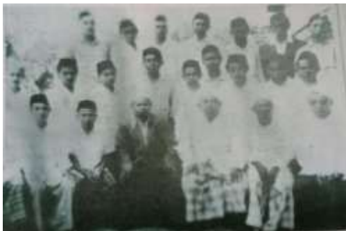
Gambar Karamah ke-12