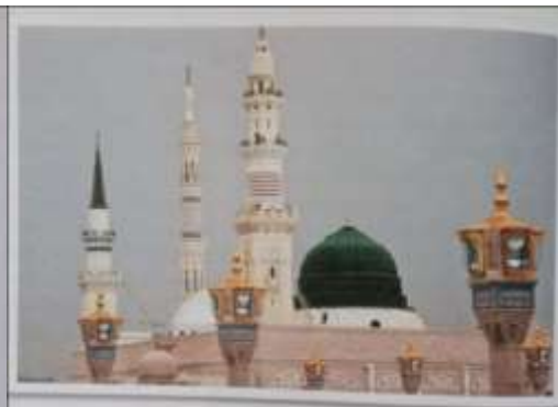
Gambar Karamah ke-85