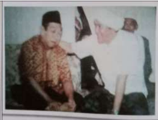
Gambar Karamah ke-83