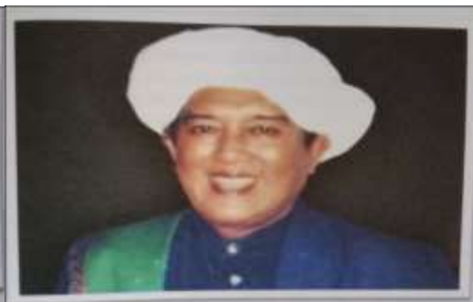
Gambar Karamah ke-99