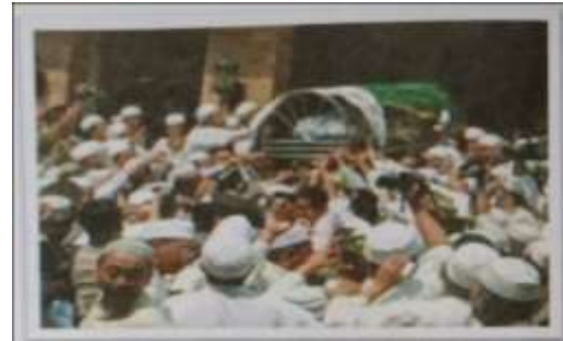
Gambar Karamah Ke-94