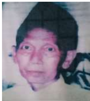
Gambar Karamah ke-32