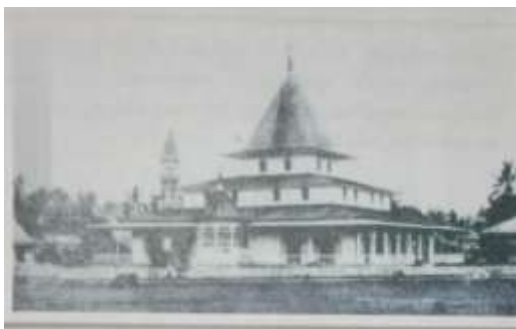
Gambar Karamah ke-1