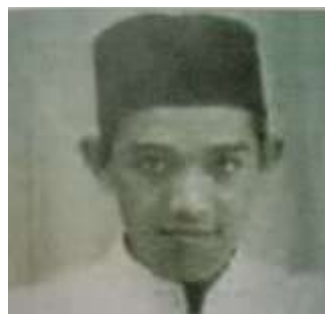
Gambar Karamah ke-10