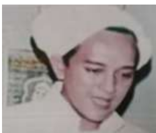
Gambar Karamah ke-13