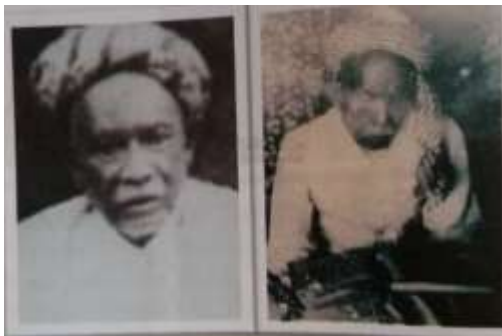
Gambar Karamah ke-7