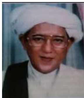
Gambar Karamah ke-65