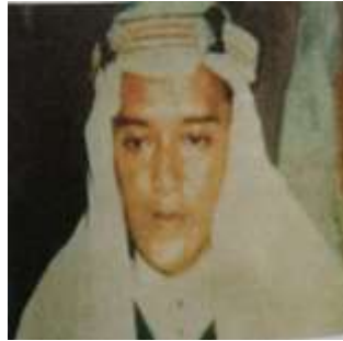
Gambar Karamah ke-28