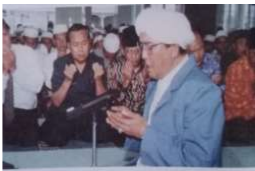
Gambar Karamah ke-54