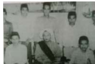
Gambar Karamah ke-16