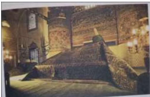
Gambar Karamah ke-86