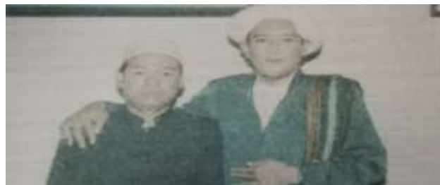
Gambar Karamah ke-62