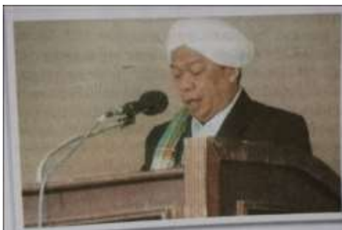
Gambar Karamah ke-97