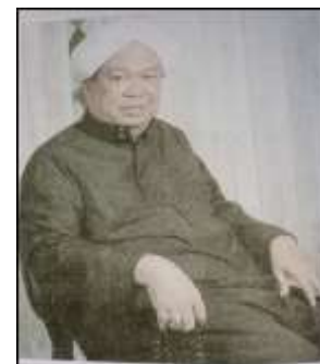
Gambar Karamah ke-71