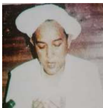
Gambar Karamah ke-37