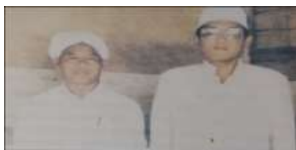
Gambar Karamah ke-67