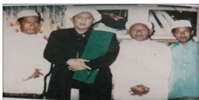
Gambar Karamah ke-57