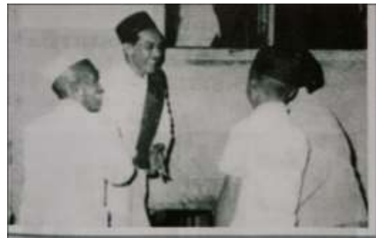
Gambar Karamah ke-6