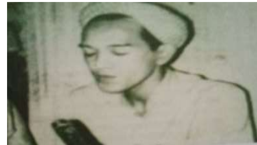
Gambar Karamah ke-22