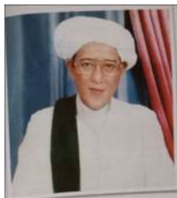
Gambar Karamah ke-98