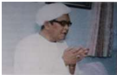
Gambar Karamah ke-61