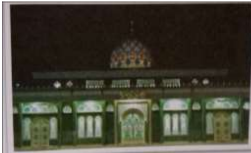
Gambar Karamah ke-92