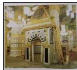
Gambar Karamah ke-91