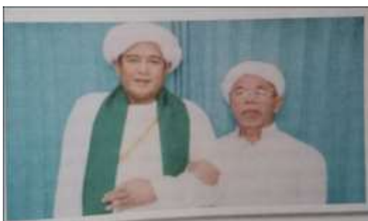
Gambar Karamah ke-78