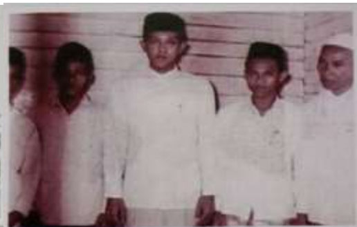
Gambar Karamah ke-2