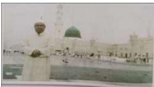
Gambar Karamah ke-71