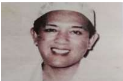
Gambar Karamah ke-25