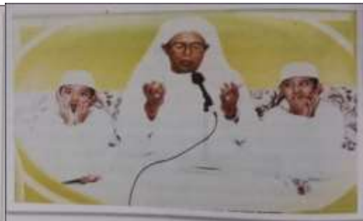
Gambar Karamah ke-77