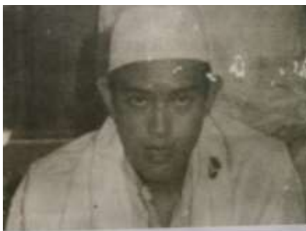
Gambar Karamah ke-3