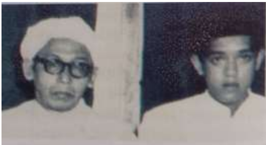
Gambar Karamah ke-20