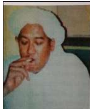
Gambar Karamah ke-33