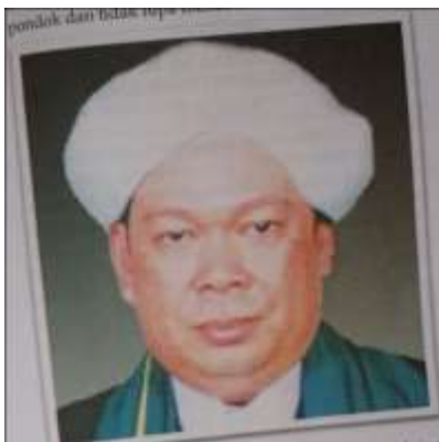
Gambar Karamah ke-95