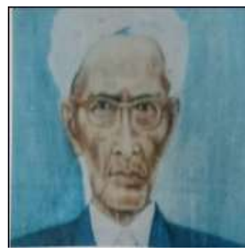
Gambar Karamah ke-40