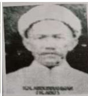
Gambar Karamah ke-4