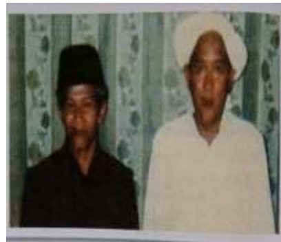
Gambar Karamah ke-34