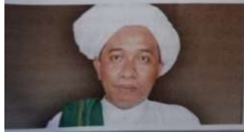
Gambar Karamah ke-55