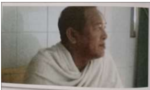
Gambar Karamah ke-75