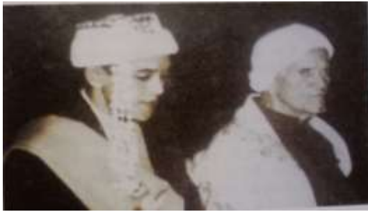
Gambar Karamah ke-18