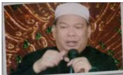
Gambar Karamah ke-35