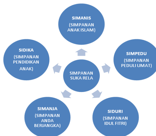
Gambar. 4.2 Jasa Layanan Simpanan

Simpanan sukarela yang ada di KSPPS BMT Mujahidin terdiri dari: