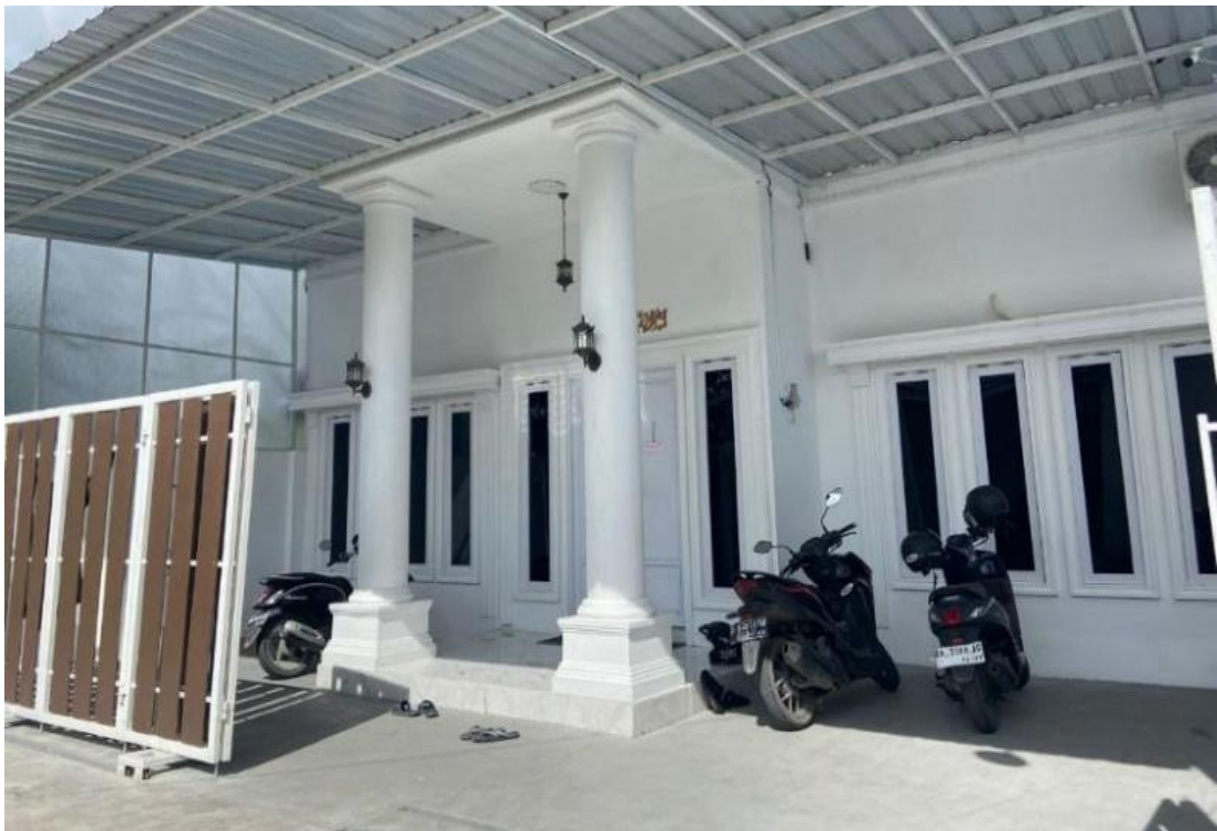
Gambar 4.2 Tampak depan Kantor Pelayanan PT. Turbah Wisata Indah