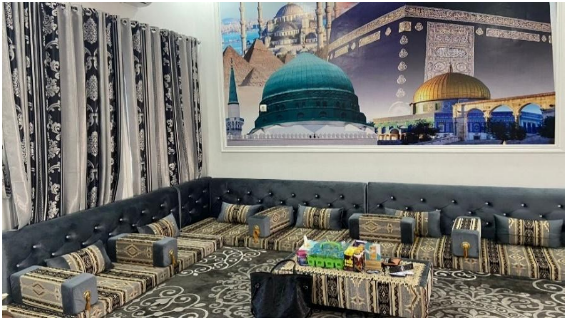
Gambar 4.3 Tampak dalam ruangan pelayanan jemaah PT. Turbah Wisata Indah

Berikut ini daftar fasilitas dan perlengkapan atau inventaris yang ada di PT.