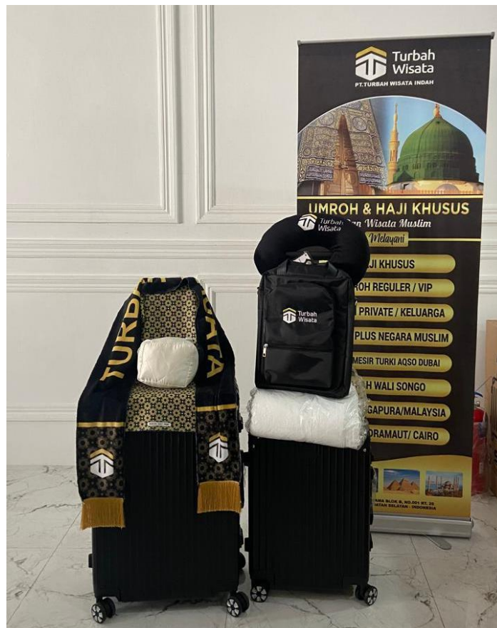
Gambar 4.4 Perlengkapan Umrah di PT. Turbah Wisata Indah

selaku alumni jemaah umrah 2023 mengatakan bahwa kualitas perlengkapan seperti koper dll. Itu semua didapatkan sesuai harapan dan sampai sekarang masih kuat. 41 Ditambahkan juga oleh Ibu Nurul Amalia selaku alumni jemaah 2023 bahwa perlengkapan yang diberikan sejauh ini kualitasnya bagus, kuat dan tidak ada rusak. Sampai datang kembali pun tidak ada yang rusak. 42