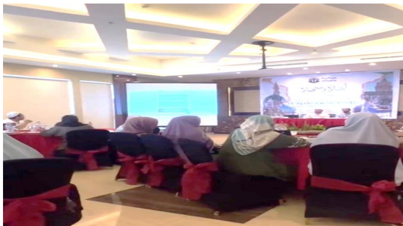
Gambar 4.1 Kegiatan Bimbingan Manasik Umrah PT. Turbah Wisata Indah 19