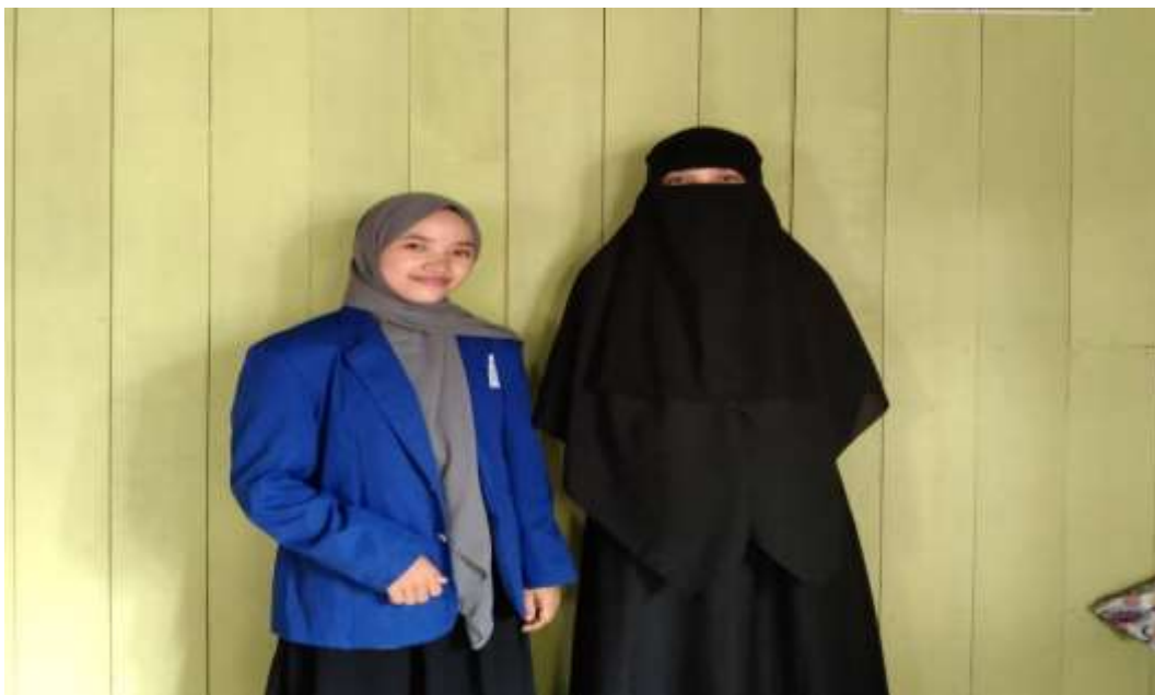
Gambar 4 : Foto Bersama setelah wawancara dengan jamaah yang pernah menggunakan jasa PT. Qolbu Amanah Perdana