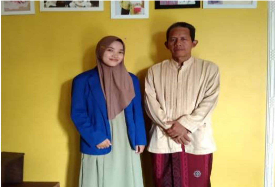
Gambar 5 : Foto Bersama setelah wawancara dengan jamaah yang pernah menggunakan jasa PT. Qolbu Amanah Perdana