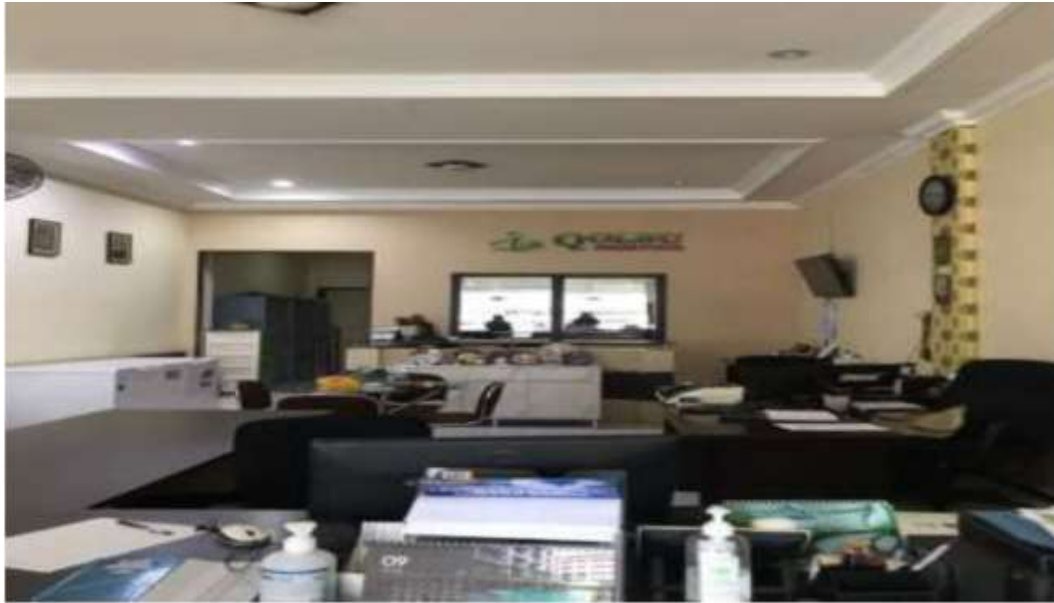
Gambar 1 : Ruangan Kerja PT. Qolbu Amanah Perdana