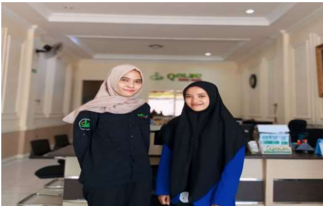
Gambar 6 : Foto Bersama setelah wawancara dengan Admin PT. Qolbu Amanah Perdana