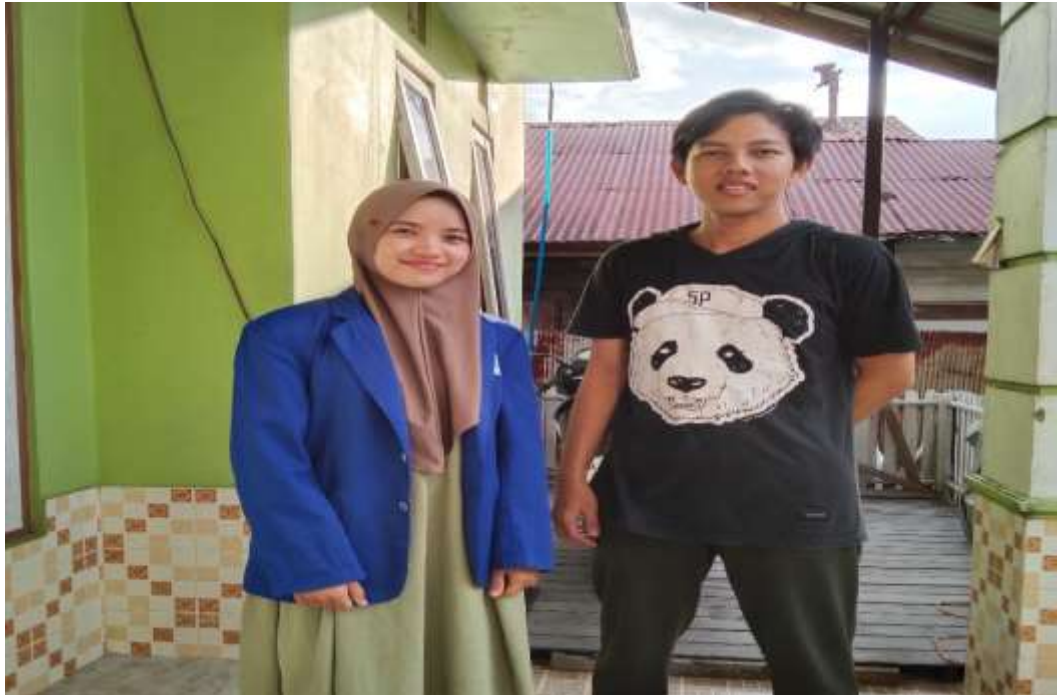
Gambar 3 : Foto Bersama setelah wawancara dengan jasmaah yang pernah menggunakan jasa PT. Qolbu Amanah Perdana