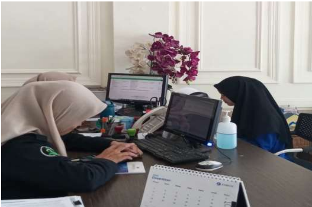
Gambar 7 : Foto Saat Wawancara dengan Karyawan PT. Qolbu Amanah Perdana