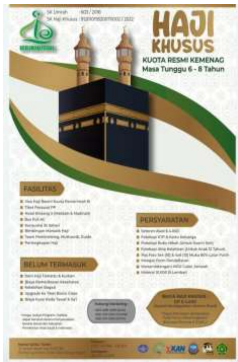
Gambar 4. 1 Brosur Haji PT. Qolbu Amanah Perdana