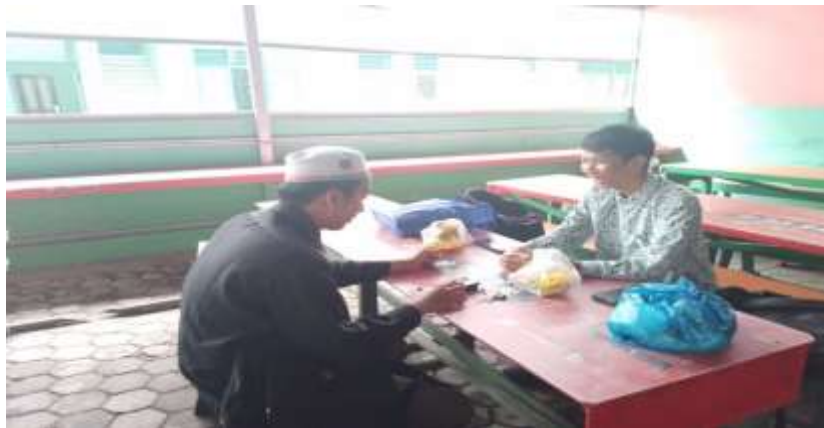
Pelaksanaan Kegiatan Majelis Ta'lim di hari Selasa setelah jam belajar-mengajar selesai